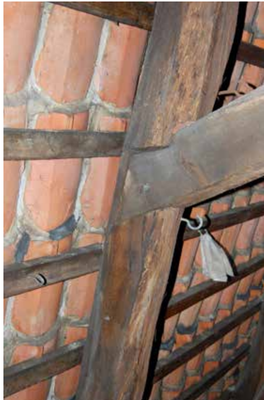
Historisches Dachwerk mit Schwalbenschwanzblatt und Tonpfannendeckung in Kalkmörtel

Große Antennen-, Solar- und Photovoltaikanlagen auf Dächern sind in der Regel nicht zulässig, weil sie das Gesamtbild zu stark beeinträchtigen.