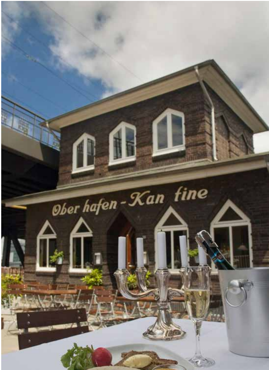
Oberhafenkantine, 1925, Architekt: Willy Wegner