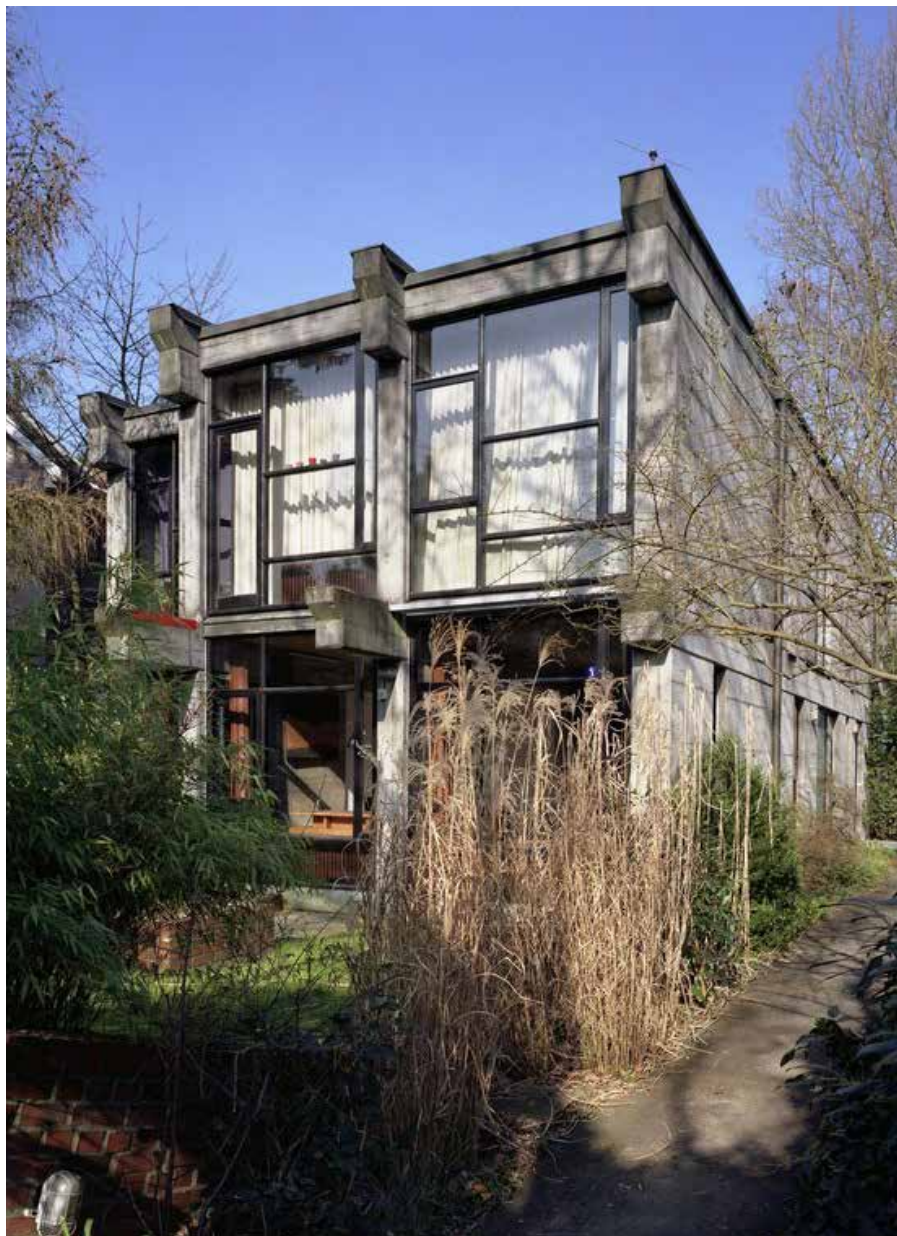
Wohnhaus in Othmarschen, 1972–75, Architekt: Thomas Darboven