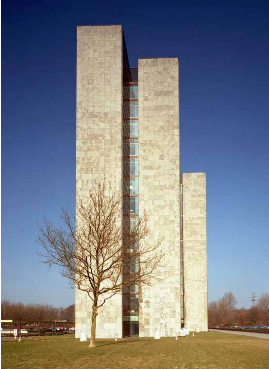
HEW-Verwaltung (heute Vattenfall), City Nord, 1965–69, Architekt: Arne Jacobsen