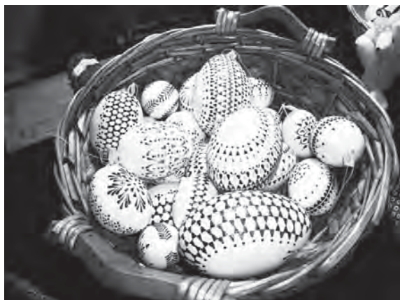
Hübsches österliches Kunsthandwerk wartet wieder im Museum Elbinsel Wilhelmsburg auf Käufer.