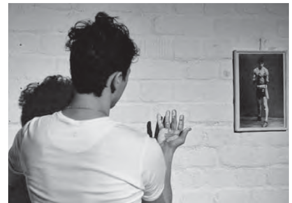
Was macht die Identität junger Sinti aus? Ein Theaterstück sucht Antworten.