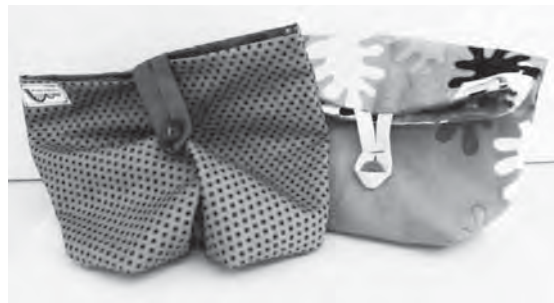
Schöne handgefertigte Taschen in tollen Farben (die man bei uns leider nicht sieht) sind eines der Produkte der Schülerfirma „Produktart Elbinsel“.

Profilklasse der Stadtteilschule Wilhelmsburg als Schülerfirma „Produktart Elbinsel“