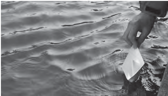
Segel setzen und los!

Premiere: Sonnabend, 5.4., 19 Uhr, im Bürgerhaus Informationen über weitere Aufführungen auf www.buewi.de Eintritt: 5 €, Reservierung unter Tel. 040 75 20 17-15; volkmarhoffmann@buewi.de