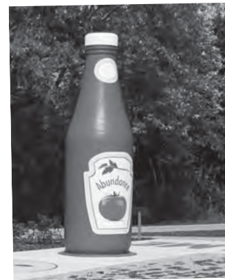
Die Ketchupflasche ist 4 Meter hoch, Preis VH. Die Kaffeepott-Redaktion überlegt noch.