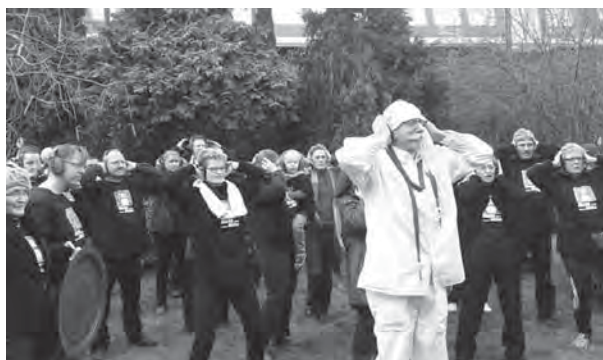
Lärm-Yoga an der Bahnlinie.

Warum wurde nicht erst der neue Lärmschutz an der Bahn gebaut, bevor der alte abgerissen wurde?