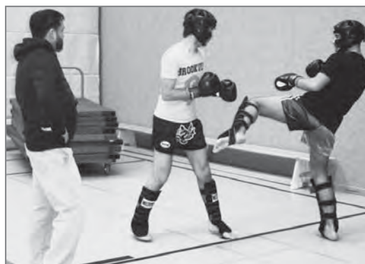
Koordinationsschulung: Beim Thaiboxen werden Hände, Ellenbogen und Knie eingesetzt.

Thaiboxen: Di., Mi., Fr., jeweils 19 h, im Sprach- und Bewegungszentrum, Rotenhäuser Damm 40 Kostenlos + für alle