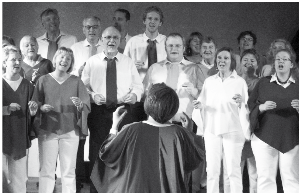
Die Swinging Colors begeisterten auf dem ersten Kultursonntag im Stadtteilhaus Lurup.

oder: Molière in Behandlung“ mit Heike Klockmeier. Am 17. November spielt die Stadtteilbühne im Rahmen des Kultursonntags um 16 Uhr den „Froschkönig“. Dann gehe es am 19. Januar 2014 weiter mit einer Gedenkveranstaltung anlässlich des 100. Todestags von Alfred Lichtwark, dem Namensgeber des Lichtwark-Forum Lurup e.V. Hierfür werden noch Beiträge aus dem Stadtteil gesucht. Auch ein Tanztee oder eine Lesung könnten noch für 2014 geplant werden. Die AG Kultursonntage ist offen für weitere Interessierte, die Lust haben, in Lurup Kulturveranstaltungen mit Kultur-Café zu planen, zu organisieren und zu gestalten. Weitere Information: Tel. 822 96 05 31, kultursonntag@unser-lurup.de sat