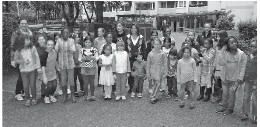
Die Mädchengruppe vom Luruper Sportsommer am Lüdersrings