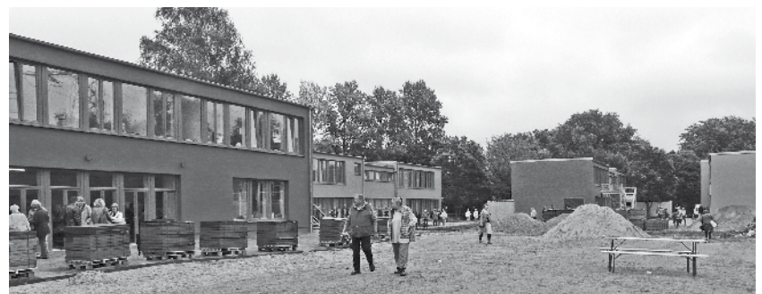
Noch Baustelle: Die Außenanlagen zwischen den Pavillons des Bürgerhauses

Am 14.9. wurde das Bürgerhaus Bornheide an der Bornheide 76 / Glückstädter Weg 75 mit einem großen Fest eingeweiht. Viele haben dazu beigetragen, dass am Osdorfer Born nach mehr als zehn Jahren Planung, Um- und Neuplanung heute in fünf umgebauten Gebäuden der ehemaligen Grundschule Am Barls ein Bürgerhaus mit 20 sozialen und Bildungs-Einrichtungen,