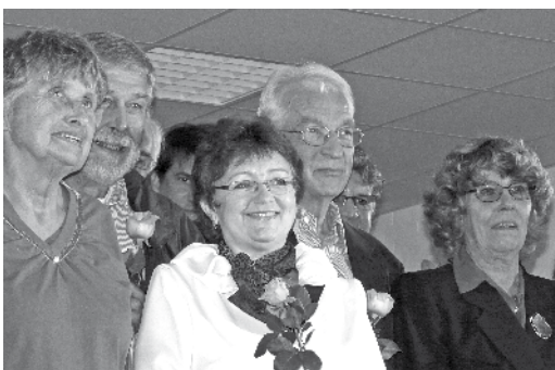
Die Borner Runde nimmt den Dank für ihr unermüdliches Engagement für die Planung eines Bürgerhauses entgegen.