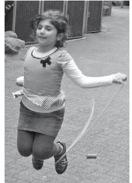
Freude am Seilspringen vor dem Nachbarschaftstreff.