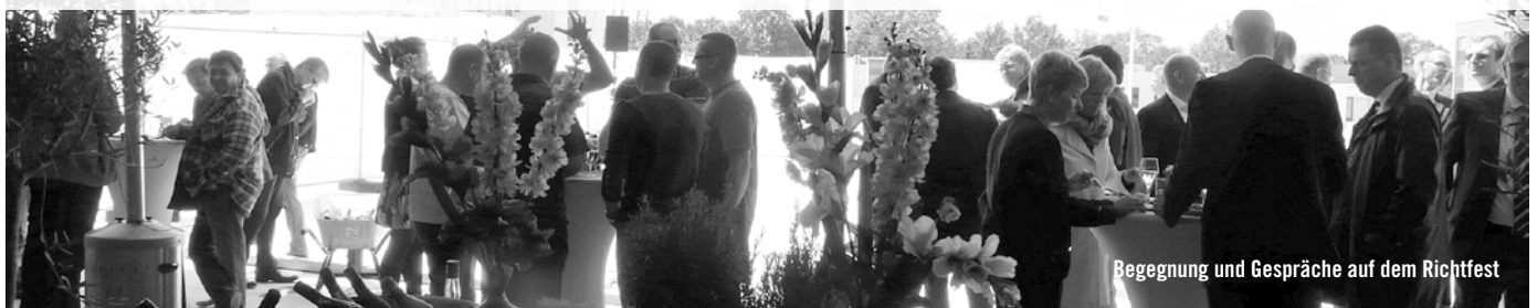
Begegnung und Gespräche auf dem Richtfest

mietet seien, u.a. an einen Kaufland-Verbrauchermarkt, Bekleidungsgeschäfte, Drogerie, Zeitschriften- und Buchhandel. Er versprach den Luruper/innen aber mehr als ein Einkaufszentrum: Gemeinsam mit den benachbarten Schulen, dem Ärztezentrum, sozialen Einrichtungen und den etwa 500 noch im Bau befindlichen Wohnungen soll der Eckhoffplatz wieder ein echtes Ortszentrum mit vielen Begegnungsmöglichkeiten werden. Fertig gestellt werden soll das Center im Oktober 2012. sat