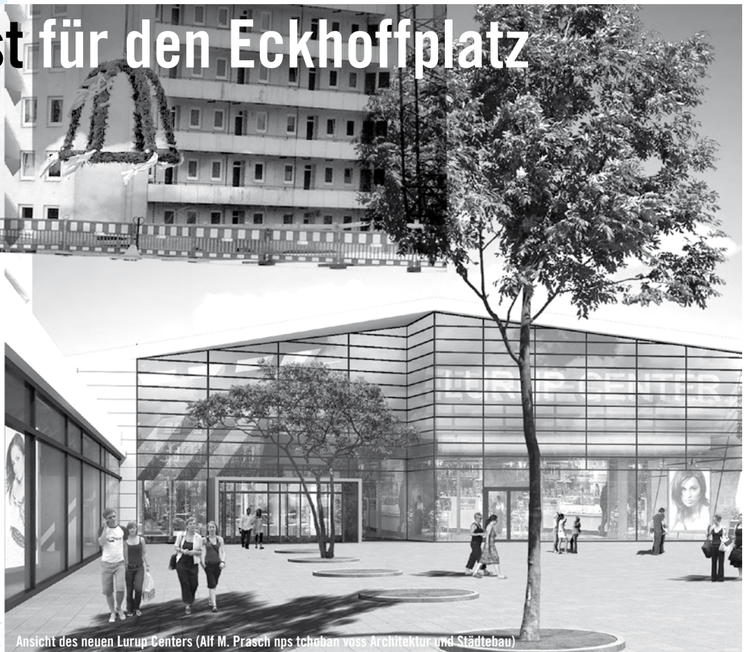
Ansicht des neuen Lurup-Centers