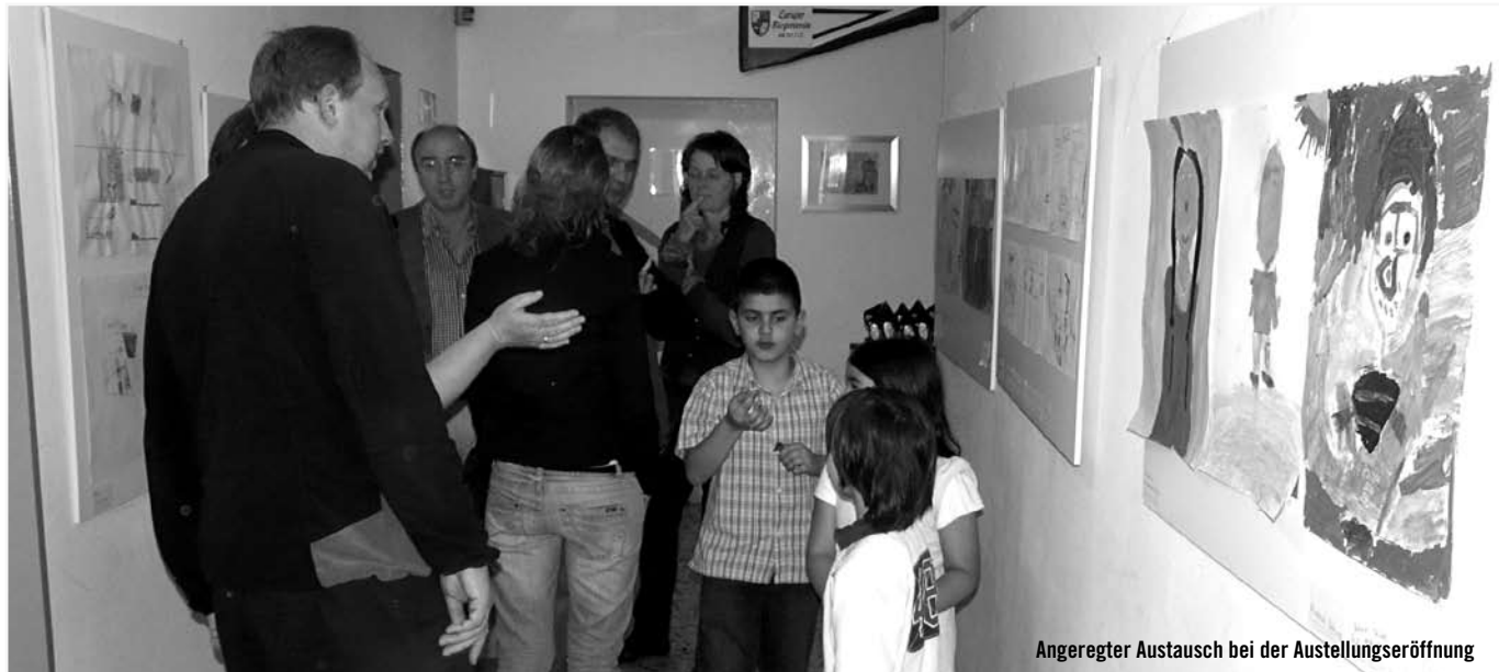
Angeregter Austausch bei der Ausstellungseröffnung