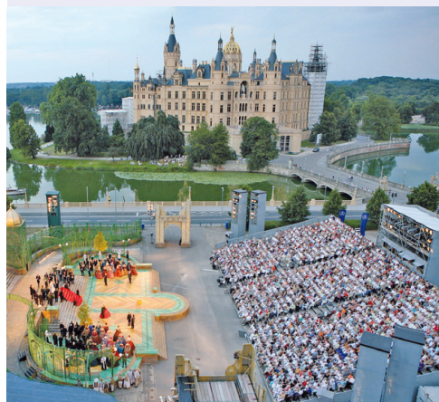
Ein großes Musikdrama vor großartiger Kulisse. Nabucco bei den diesjährigen Schlossfestspielen in Schwerin.

Schlossfestspiele Schwerin vom 27. Juni bis zum 3. August. Kartenbestellungen unter Tel.: 0385/53 00-123 oder online im Internet unter www.theaterschwerin.de . Senioren ab 65 Jahren erhalten je € 10,- Ermäßigung! Über das Online-Ticketing können leider keine ermäßigten Karten verkauft werden. Hierzu wenden Sie sich bitte direkt an die Mitarbeiter der Theaterkasse.