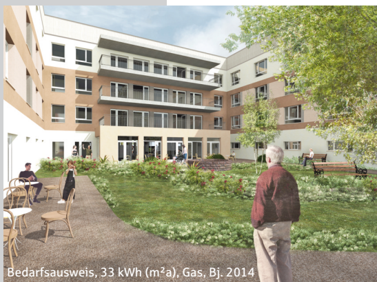
Bedarfsausweis, 33 kWh (m 2 a), Gas, Bj. 2014