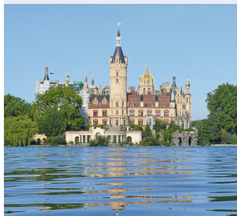
Alles auf einen Blick: Schloss, Theater und Museum umgeben die Bühne auf dem „Alten Garten“ in Schwerin.