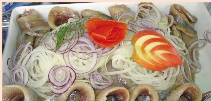
Matjes 4 © Krause

Musik ein tragendes Element in Glückstadt sein. Man rückt enger zusammen, damit für die Bühnen, die Stände vom Kunsthandwerk bis zum Flohmarkt Platz ist. Auch in diesem Jahr haben sich die Initiatoren viel einfallen lassen, um für jeden Besucher mindestens eine Attraktion bereit zu haben. Und Matjes gibt es natürlich auch bei dem nach ihm benannten Volksfest an der Unterelbe. F.J. Krause © SeMa