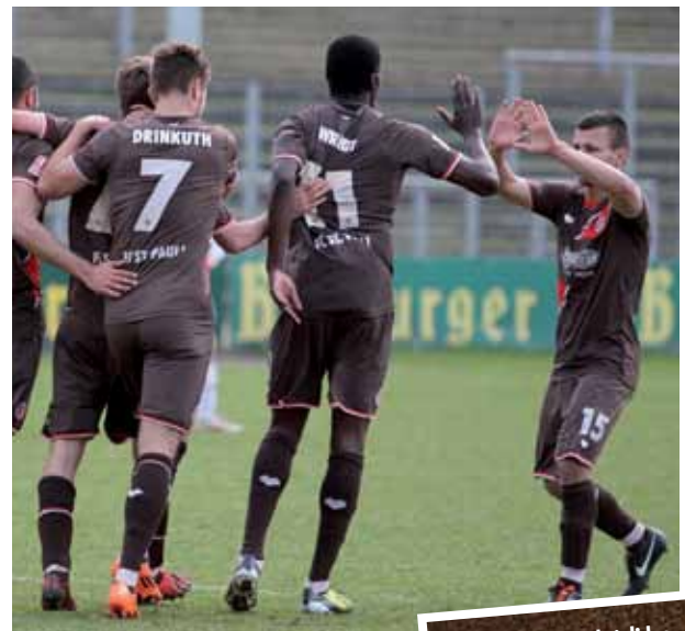
Zurück in der Spur: die U23 des FC St. Pauli

Ärgern musste er sich dann über die anschließende 0:3-Pleite gegen Eintracht Norderstedt. „Es war eigentlich ein 0:0-Spiel, das wir in der zweiten Halbzeit für uns hätten entscheiden müssen“, blickte Meggle zurück. Aufgrund dreier später Gegentreffer, darunter ein Eigentor zum 0:1 und ein abgefälschter Ball zum 0:3, kassierten die Braun-Weißen die erste Pleite seit Ende November. „Wir haben uns von der