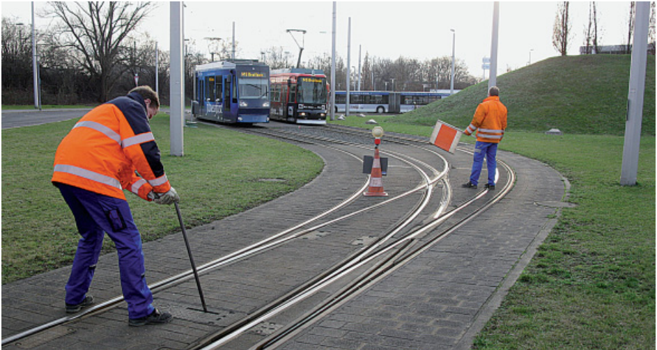
Abbildung 3: Wenn eine Baustelle in einem in Betrieb befindlichen Gleis betreten werden muss, so ist zuvor die Zustimmung des Sicherungspostens oder der Sicherheitsaufsicht einzuholen.