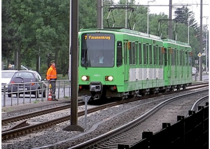
Abbildung 2: Bei Arbeiten in nicht gesperrten Gleisen muss Warnkleidung getragen werden. Für eine optimale Erkenn- barkeit sind Westen und Jacken zu schließen.