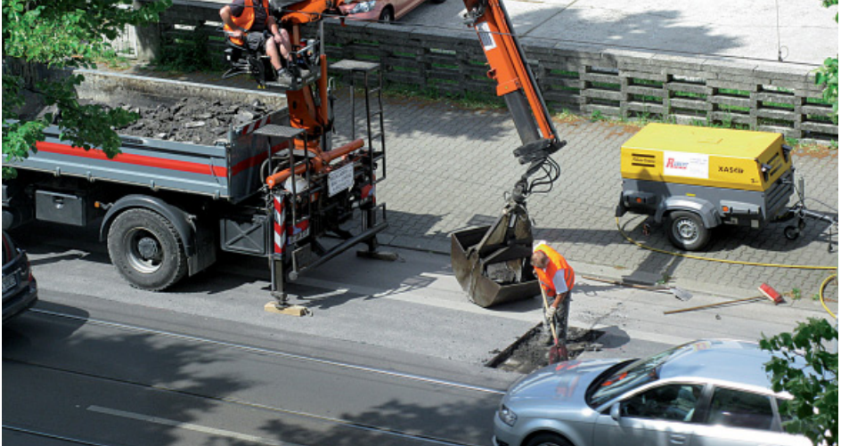
Abbildung 1: In oder in der Nähe von Gleisen darf erst mit den Arbeiten begonnen werden, wenn der Straßenbahnbetrieb zugestimmt hat.

Führen betriebsfremde Unternehmen Arbeiten aus, bei denen Personen in Gleisen oder in deren Nähe tätig werden oder die den sicheren Bahnbetrieb gefährden können, müssen sie vorher die Zustimmung des Straßenbahnbetriebes einholen. Die Sicherungsmaßnahmen bei diesen Arbeiten werden durch das Straßenbahnunternehmen festgelegt oder genehmigt.