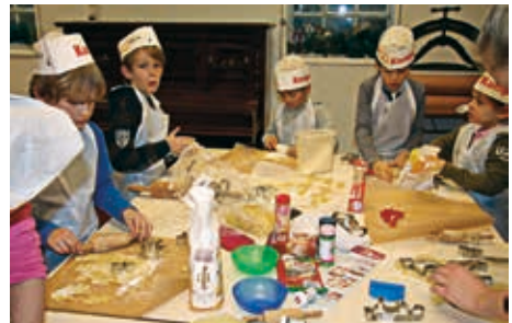
Die Lütten sind eifrig bei der Sache

Im letzten Jahr musste das Plätzchenbacken im Heidbarghof wegen mangelnden Interesses abgesagt werden. Auch in diesem Jahr waren es nur 23 Kinder, die zum