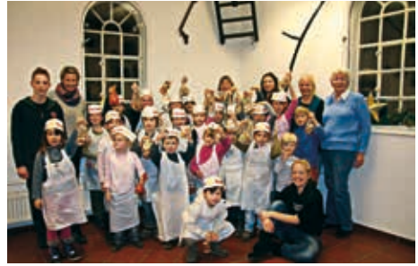
Stolz präsentieren die kleinen Bäcker ihre Kekstüten

Backen kamen – die aber hatten ihren Spaß dabei!