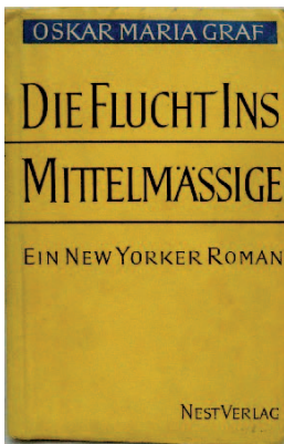
1 Oskar Maria Graf: Die Flucht ins Mittelmäßige . Ein New Yorker Roman, Frankfurt a. M. 1959, Seitenangaben im Text.

in Oskar Maria Grafts Die Flucht ins Mittelmäßige (1959)