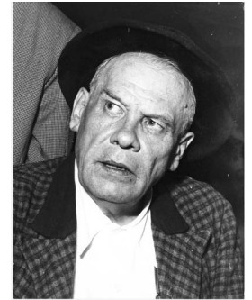
Oskar Maria Graf (1894–1967)