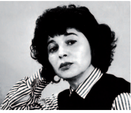
Mascha Kaléko (1907–1975)

1929 tritt Mascha Kaléko erstmals öffentlich als Dichterin in Erscheinung. Die Zeitschrift Der Querschnitt druckt zwei ihrer Gedichte: „Spießers Frühlingserwachen“ und „Zwischen zwei Fenstern“. Beide sind im Berliner Dialekt geschrieben. Nicht nur stilistisch, auch inhaltlich sind Kalékos Gedichte eng mit dem Großstadtleben verbunden. 1933 erscheint ihr erster Gedichtband. Das lyrische Stenogrammheft. Verse vom Alltag . Das Debüt findet viel Anerkennung und verkauft sich gut. Ab 1935 darf Kaléko auf Grund des von den Nationalsozialisten verhängten Schreibverbotes nicht mehr publizieren. Ihr zweiter Band, Kleines Lesebuch für Große. Gereimtes und Ungereimtes , wird noch in der Druckerei beschlagnahmt. 1938 flüchtet Kaléko mit Mann und Sohn aus Berlin ins amerikanische Exil. Nach der Flucht nach Übersee blieben Veröffentlichungserfolge aus. Erst 1945 erscheint unter dem Titel Verse für Zeitgenossen wieder ein Gedichtband. Schmerz und Trauer prägen die darin enthaltenen Gedichte ebenso wie das Gefühl von Heimatlosigkeit und Heimweh. 1960 emigriert Kaléko mit ihrem Mann nach Jerusalem. 1974 tritt sie ihre letzte Reise nach Europa an. Auf dem Rückweg nach Israel stirbt sie 1975 in Zürich.