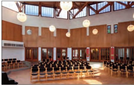
Der Festsaal der Martin Luther King Kirche - hier soll zu Pfingsten das 40jährige Jubiläum gefeiert werden

Etwa um 1904 war Steilshoop noch ein Dorf im Kreis Stormarn und gehörte in dieser Zeit zum Kirchspiel Bergstedt in den Pfarrbezirk Bramfeld. Erst um 1952 wurde Steilshoop dann ein eigener Pfarrbezirk und wenn man dies mit anderen Kirchen oder Gemeindezentren vergleicht, ist das nach Kirchenzeitrechnung fast schon jugendlich.