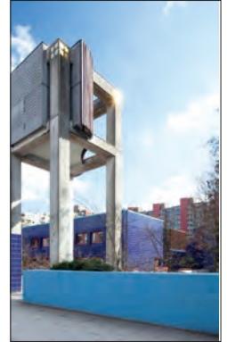
In strahlendem Sonnenschein sieht er nochmal so schön aus: der Turm der Martin Luther King-Kirche

40 Jahre mit allen Freunden und Gemeindegliedern feiern. Das Festkomitee hat sich ein abwechslungsreiches Programm für Groß und Klein, für jung und nicht-mehr-ganz-jung überlegt. Jeder ist in der Martin Luther King-Kirchengemeinde herzlich willkommen. Die Feierlichkeiten beginnen am Freitag, den 6. Juni im Einkaufszentrum Steilshoop im Schreyerring. Dort präsentieren sich in der Zeit von 10 bis 17 Uhr die aktiven Gruppen aus der Martin Luther King-Kirchengemeinde und laden zum Mitmachen ein. Ab 20 Uhr findet ein großer Tanzabend im Gemeindezentrum an der Gründgensstraße 28 statt. Ein DJ wird kräftig einheizen, Getränke und Snacks können günstig erworben werden und der Eintritt ist natürlich frei. Am Samstag, den 7. Juni findet von 12 bis 15 Uhr ein internationales Mittagessen im Gemeindezentrum statt. Jeder der möchte, bringt einen Essensbeitrag für 5 Personen zu unserem reichhaltigen Buffet mit und kann sich dann am Buffet laben. Dieser Essensbeitrag soll die Vielfältigkeit der Kulturen dieser Stadt und besonders dieses Stadtteiles widerspiegeln. Frei nach dem Motto: Was für den einen der Labskaus ist, ist für den anderen der Couscous-Salat. Wer nichts mitbringen kann ist trotzdem herzlich eingeladen. Es ist eine kleine Geldspende erwünscht. (ts)