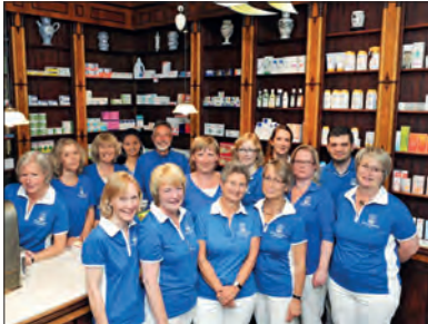
Viele Bramfelder kennen das tolle Team der Neptun-Apotheke bereits seit vielen Jahren

Von Beginn an ist die Neptun Apotheke bereits Brain Mitglied und war und ist nicht mehr aus Bramfeld wegzudenken. Mit ihrer markanten Lage direkt neben dem berühmten Eiscafe Dante gehört die Neptun Apotheke einfach ins Bild des Stadt-