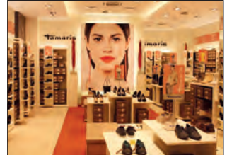
Hier macht Schuhe kaufen Spaß: Der einladende Shop von Tamaris in der Marktplatz Galerie Bramfeld

Junge Mode, von elegant bis sportlich und für jeden Anlass findet man bei Tamaris. Ob Pumps, Schnürschuh, Slipper, Mokassin oder Sommerstiefeletten: In vielen Größen und aktuellen Frühlingstrendfarben ist das Schuhwerk hier zu bestaunen und lässt so gut wie keine Wünsche offen. Doch ein gutes Schuhgeschäft lebt nicht vom Schuh allein. Kompetente und umfassende Beratung stehen bei Tamaris ganz oben auf der Liste. Sollte ein Schuh in der gewünschten Größe einmal vergriffen sein? Kein Problem! Ein Anruf und die freundliche Mitarbeiterin hat ihn in einer anderen Filiale ausfindig gemacht. Hier länger zu verweilen und einen Schuh nach dem anderen anzuprobieren, macht wirklich Spaß. Die Räumlichkeiten sind hell und freundlich und viele bequeme Sitzgelegenheiten und angenehme Beleuchtung - die den Schuh samt Bein gut in Szene setzen – machen den Schuhkauf zum reinen Vergnügen. Alles neu macht der Mai – oder vielleicht sogar schon der März?! Auf zum Schuhkauf bei Tamaris. (ts)