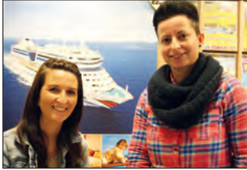
Das freundliche und professionelle Team freut sich mit Ihnen auf Ihren nächsten Urlaub

Wem es bei diesen Temperaturen noch nicht frühlingshaft genug ist und in die Sonne zieht, der sollte zu diesem Zweck beim Thomas Cook Reisebüro in der Marktplatz Galerie vorbeischaun. Seit der Eröffnung der Marktplatz Galerie befindet sich das Office, das Urlaubs-