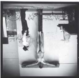
Joseph Beuys: „Ich träumte, daß das Christentum jetzt eine Chance hat“, 1965

Stade, westlich von Hamburg gelegen, ist immer einen Ausflug wert – besonders lohnenswert ist es jetzt im Herbst. Ab dem 12. Oktober präsentiert das Kunsthaus Stade mit der Ausstellung „Jesus reloaded – Das Christusbild im 20. Jahrhundert“ faszinierende Perspektiven auf die Figur Christi. Sie richtet ihren Blick auf die Zeit vom Ende des 19. bis zum Beginn des 21. Jahrhunderts. Und zeigt, dass die Darstellung und Interpretation der Figur Christi sehr überraschende und vielfältige Formen angenommen hat und einer ganzen Reihe bedeutender Künstler zur Inspiration diente. Die umfangreiche Schau umfasst u.a. Werke von Gauguin, Kokoschka, Dix, Beckmann, Chagall, Picasso, Baselitz, Beuys, Tübke und Heisig bis hin zu amerikanischen Künstlern wie Robert Rauschenberg und Keith Haring.