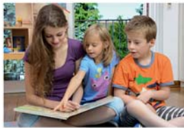
Stöberecke S. 24