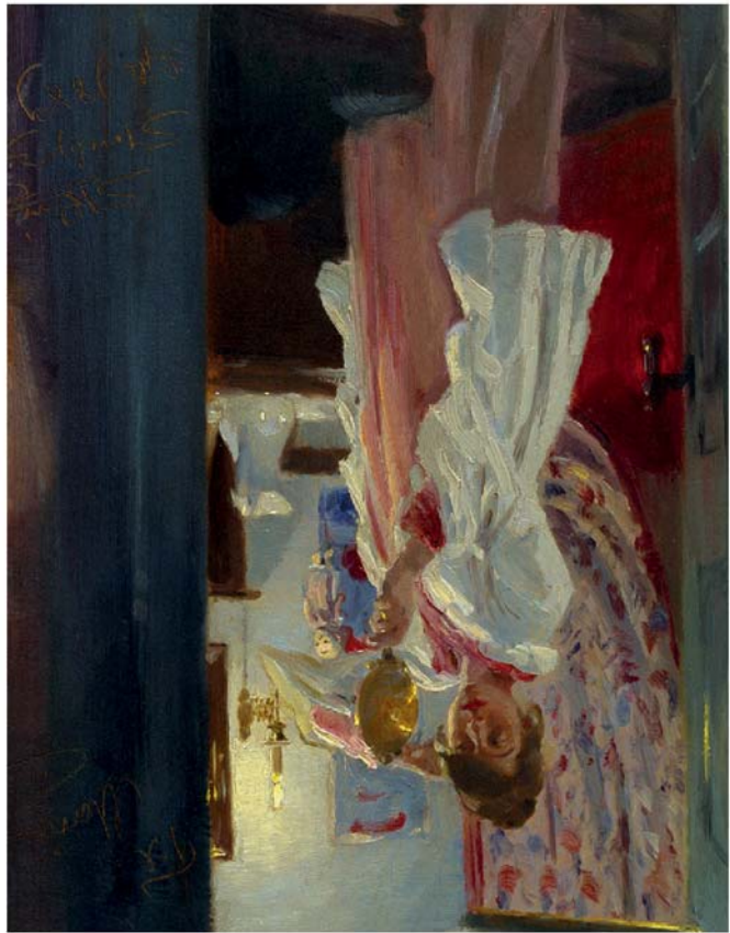
Links: Anna Ancher, „Die Magd in der Küche“, 1883/86.