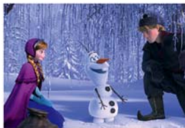
Tolle Kinotipps S. 30