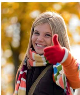
Tipps für Teens S. 32