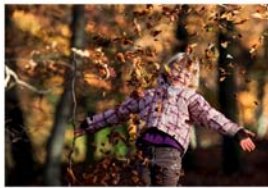
Ausflugs-Ideen S. 22