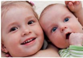
Familienzuwachs S. 6