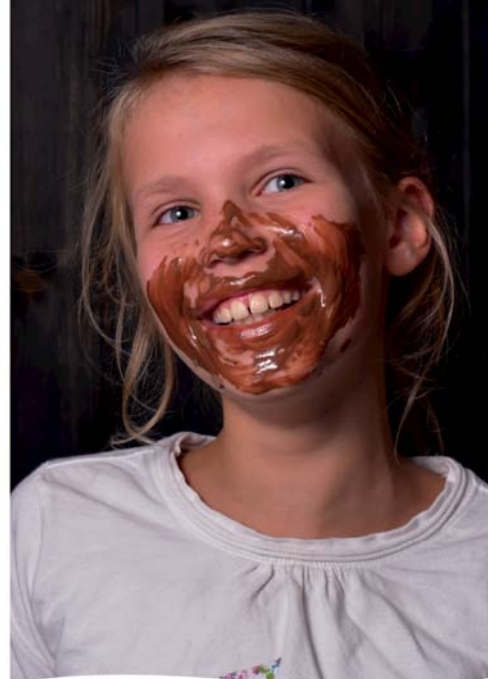
Das Schokoladenmuseum im Herzen Hamburgs