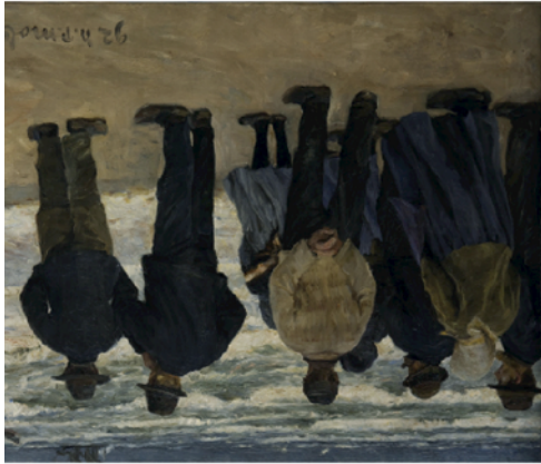
Niels Pedersen Mols, „Fischerleute“, 1892