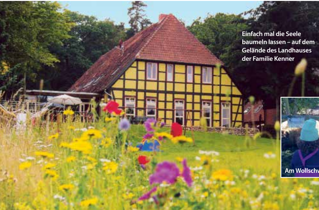
Einfach mal die Seele baumeln lassen – auf dem Gelände des Landhauses der Familie Kenner