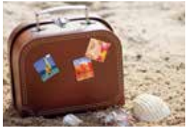
Familien-Reisen S. 4