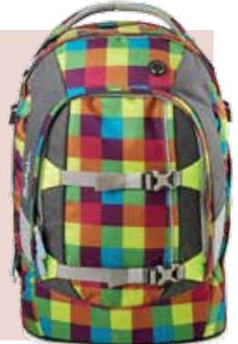
satch Modell Beach Leach