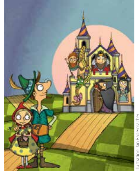
Illustration: Jan Rademacher

Eine rührende, zauberhafte und lehrreiche Geschichte aus dem Orient: Auf seiner Reise quer durch die unbekannte Welt stößt der kleine Muck auf Neider und Missgunst. Doch der clevere Muck weiß sich zu helfen: Mit magischen Pantoffeln, die ihn in Windeseile überall hintragen, und einem Stock, der ihm anzeigt, wo immer sich ein Schatz befindet, nimmt er es mit seinen Widersachern auf. Ein wunderbares Märchen über den Sieg des Guten über die Gier der Menschen, welches zeigt, dass gerade die Kleinen unter uns ganz besondere Fähigkeiten besitzen, um die wir Großen sie manchmal beneiden. www.harburger-theater.de