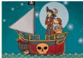
Weihnachtsmärchen S. 17