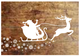
Geschenketipps S. 10