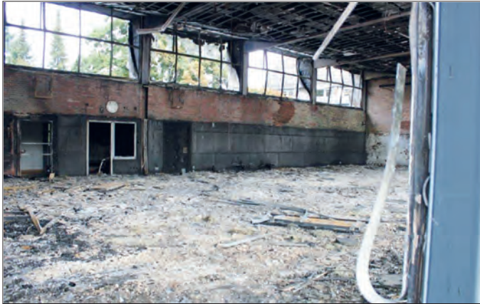
So sah die alte Halle nach dem Feuer aus.

Bramfeld. Als letztes Jahr im August die Sporthalle der Stadtteilschule Bramfeld, damals namentlich noch Schule Bramfelder Dorfplatz, niederbrannte, war das ein schwerer Schock für Schüler und Kollegium. Es folgten eineinhalb