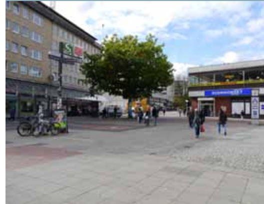
Der heutige Goetheplatz