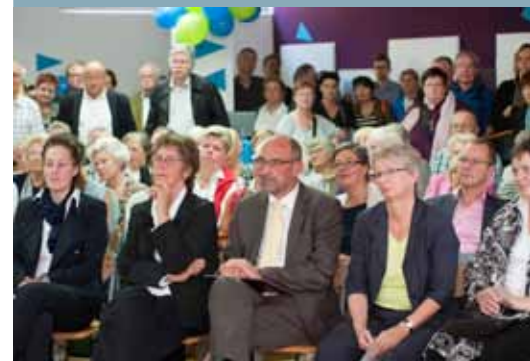
Senator Detlef Scheele bei der Eröffnungsfeier