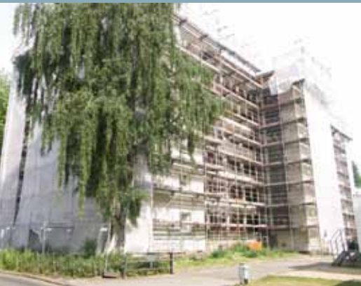
Sanierungsarbeiten in der Billrothstr. 2