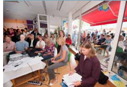
Großer Andrang in der Großen Bergstraße 189 am 22. August 2013

Öffnungszeiten 2013 Mi-Fr: 12.00 - 18.00 Uhr, Sa: 10.00 - 13.00 Uhr Kontakt: 040/39805285 info@altonavi.de www.altonavi.de