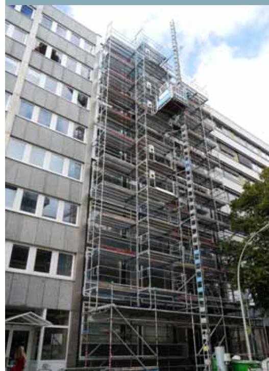
Sanierungsarbeiten in der Schillerstraße 44

Für die Fahrzeuge aus südlicher Richtung wurde eine Rechtsabbiegerspur geschaffen. Durch eine Hinzunahme der ehemaligen Linksabbiegerspur wurde es möglich, dass weiterhin zwei Fahrspuren in Richtung Norden zur Verfügung stehen.