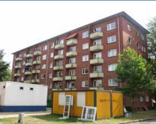
Bestandsgebäude Unzerstraße 17