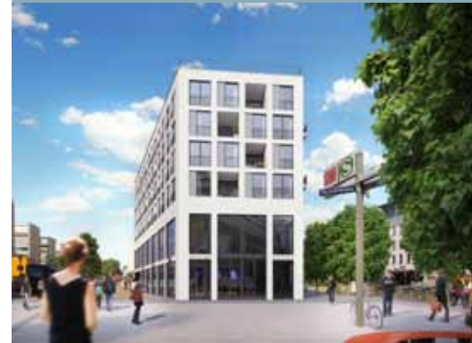
Visualisierung der zukünftigen Bergspitze (Bruhn Immobilien GmbH)

Die Diskussion um das Bauvorhaben "Bergspitze" prägte über Monate das Geschehen in der Großen Bergstraße.