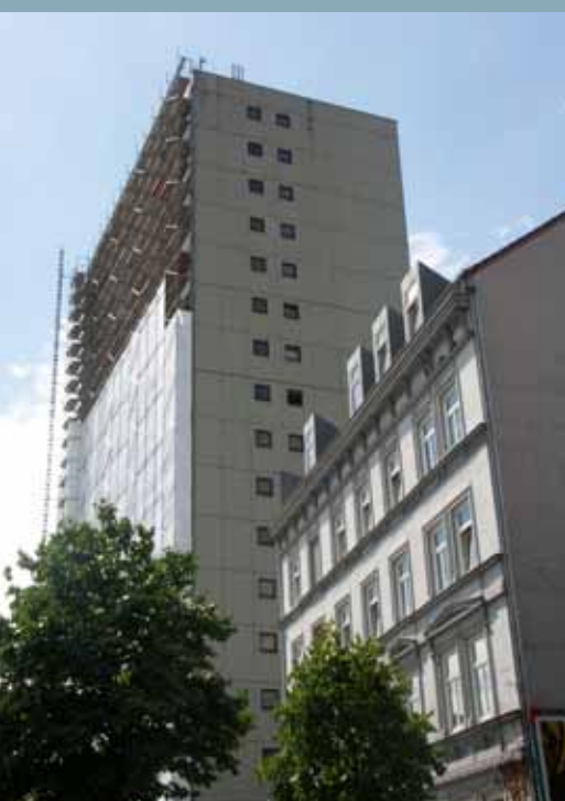
16-geschossiges Bürogebäude am Bruno-Tesch-Platz

Während die Fassade des Hochhauses am Bruno-Tesch-Platz saniert wird, gibt es auch im Inneren des Gebäudes Veränderungen. Anfang 2014 soll in dem Gebäudekomplex das zweite Studio des Freizeitsportvereins Sportspass e.V. im Altonaer Zentrum eröffnet werden. Dafür werden von der Jessenstraße zugängliche, ehemalige Büroflächen zu einem modernen, circa 2.000 m 2 großen Sport-Center mit zwei "Gyms" und einem großen Fitnessgeräte-Bereich umgebaut. Sportspass betreibt bereits seit Jahren ein Center im Bahnhofsgebäude am Paul-Neermann-Platz. Da das Center allerdings bereits seit längerer Zeit an seine Kapazitätsgrenzen stößt, wird Sportspass zukünftig mit zwei Standorten im Bereich der Großen Bergstraße vertreten sein.