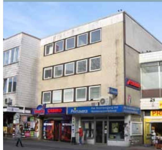
Bestandsgebäude aus den 1960ern in den Neuen Großen Bergstraße