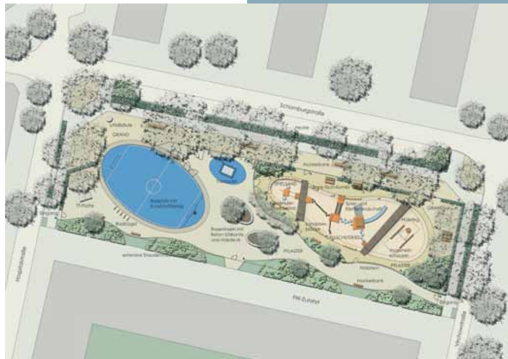
Endgültiger Entwurf zum Quartiersplatz (Grün- und Freiraumplanung GFP)

Seit dem Baubeginn im August entsteht hier der "Quartiersplatz" mit Angeboten für alle Alters- und Bevölkerungsgruppen. Neben einer Ballspielfläche mit einem neuen Gummi-Belag wird ein großflächiger Spielplatz mit Bereichen für verschiedene Altersgruppen geschaffen. Ebenso entstehen zahlreiche Sitzmöglichkeiten und weitere Angebote für Aktivitäten.