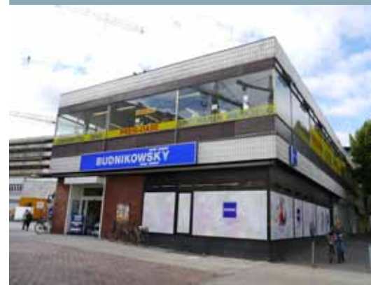
Budnikowsky im Erdgeschoss des zweigeschossigen Bestandsgebäudes