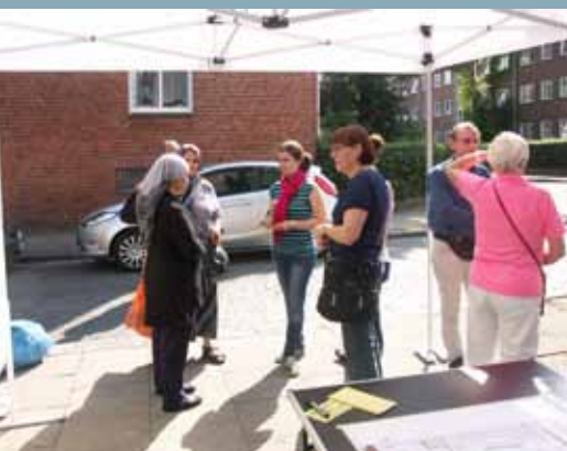
Mieterbeteiligung am 16. August 2013