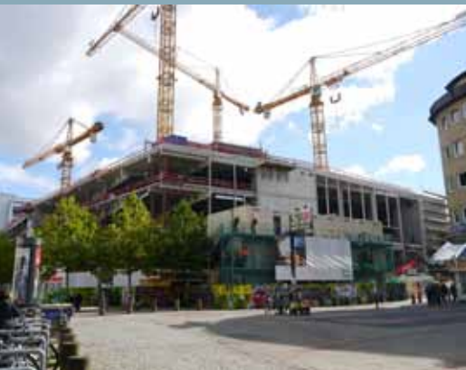
Blick auf die IKEA-Baustelle vom Goetheplatz