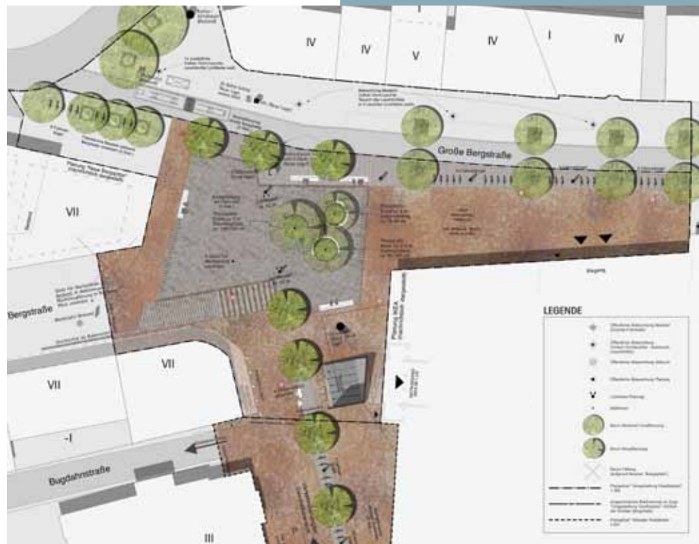
Der zukünftige Goetheplatz (LRW Architekten und Stadtplaner)