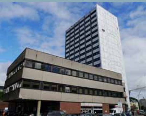
Zukünftiger Standort von Sportspass an der Jessenstraße