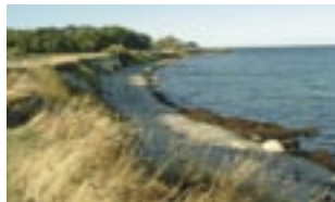
Südlichste Küste Fehmarns

Zu einer ganztägigen Sommerfahrt laden wir wieder ein. Sie findet statt am Samstag, dem 11. Juli, und hat diesmal als Ziel die wunderschöne Insel Fehmarn. Die Abfahrt mit dem Bus von der St. Gertrud-Kirche wird gegen 9 Uhr sein. Auf der Insel werden wir in einem schönen Hotel zu Mittag essen und an der Strandpromenade Kaffee trinken. Es gibt auf der Insel viel zu sehen und zu erleben, sie hat eine Jahrhunderte lange Geschichte. Die Kosten für Busfahrt, Mittagessen und Kaffee trinken, evtl. Besichtigung werden 32 Euro (Nichtmitglieder 35 Euro) betragen. Die ganz genauen Angaben werden in der nächsten Rundschau veröffentlicht. Eine Anmeldung ist bei Ehepaar Strege schon möglich (Tel. 20 98 29 71).