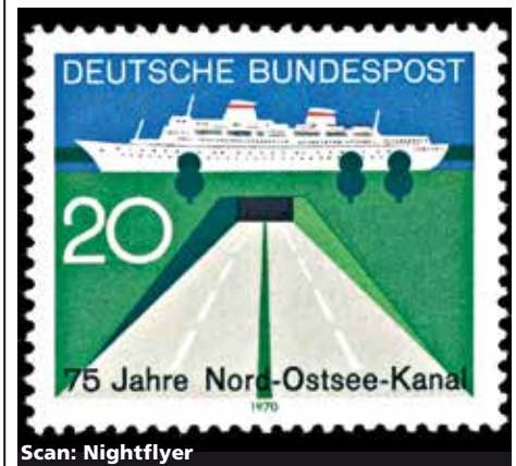
Briefmarke von 1970 anlässlich 75 Jahre Nord-Ostsee-Kanal. Abgebildet sind der Tunnel Rendsburg und ein Passagierschiff

Mit dem HamburgBus fahren wir gen Norden; genießen Sie bei dieser Fahrt die vielfältigen Blicke auf nordische Gewässer im Kreis Rendsburg und Dithmarschen. Zunächst erreichen Sie die meist befahrene Wasserstraße, den Nordostsee-Kanal und