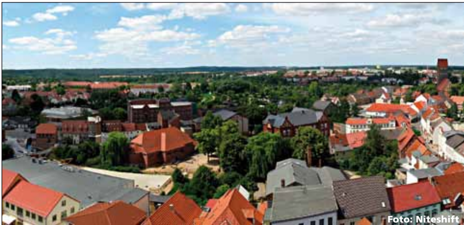
Blick vom Turm der St.-Georgen-Kirche in Parchim, Mecklenburg-Vorpommern

A m Donnerstag werden wir mit einem Reisinger-Bus Parchim (Mecklenburg-Vorpommern) ansteuern. In „Pütt“, wie die Parchimer ihre Stadt liebevoll nennen, vereinen sich Tradition, Natur und Moderne in einzigartiger Weise. Wir sehen alte Bausubstanz (Backstein-Bauwerke und zahlreiche denkmal-geschützte Fachwerkhäuser) neben Technologiezentren, Naturschutzgebiete und modernste Verkehrsinfrastruktur. In einem wunderschönen, in der Altstadt gelegenen Restaurant werden wir zum Mittagessen erwartet. Sie können wählen zwischen (1) Schollenfilet mit Salzkartoffeln und Salat bzw. (2) Sauerfleisch mit Bratkartoffeln und Salat, jeweils als Dessert Vanilleeis mit Roter Grütze. Bitte geben Sie bei der Anmeldung Ihren Essenswunsch an.