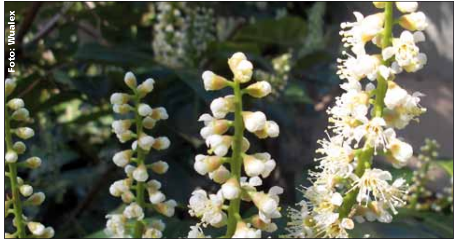
Knospen und Blüten einer Lorbeer-Kirsche ( Prunus laurocerasus )

Die Giftstoffe befinden sich hauptsächlich in der Saat und den frischen Blättern. Glücklicherweise kommt es nur sehr selten zu ernsthaften Vergiftungen, da das Fruchtfleisch keine Giftstoffe enthält und das Saatkorn beim Verzehr der Früchte in der Regel wieder ausgespuckt oder unversehrt verschluckt wird. Woran man eine Vergiftung erkennt, erfahren Sie beim Weiterlesen.