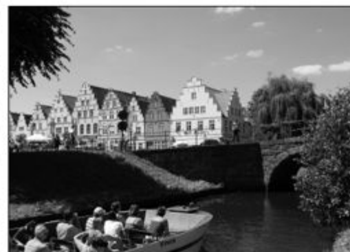
Die Grachten in Friedrichstadt (Foto oben) und das Chocoversum steben im Blickpunkt (unten)

Nach den Sommerferien ist am 14. August das Grillen im Garten geplant. Am 24. Oktober soll wieder der Latemenumzug stattfinden und bisher ist für den 9. November die Herbstausfahrt geplant. Den Abschluss bildet am 7. Dezember der traditionelle Adventskaffee für die unsere älteren Mitglieder.