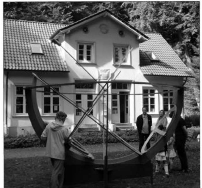
Das Sonnengangubrmodell vor dem Forsthaus des Stadtpark Vereins zieht immer wieder viele Interessierte an