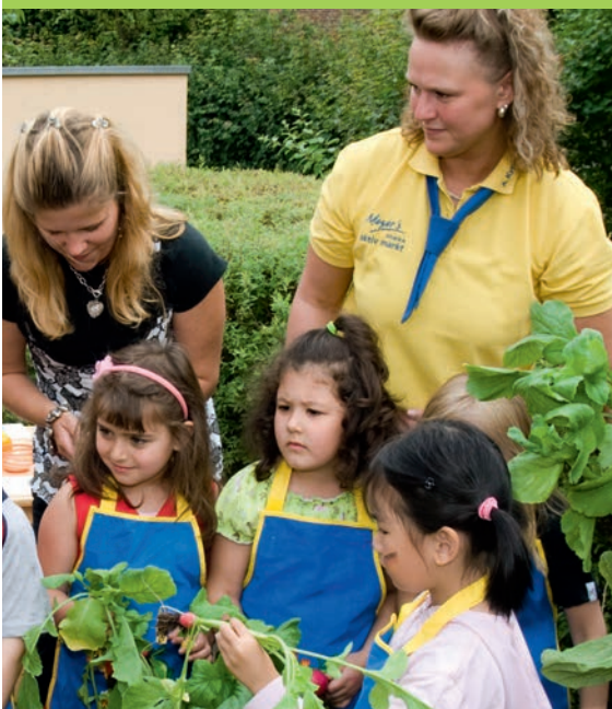
Kita in Wiesbaden