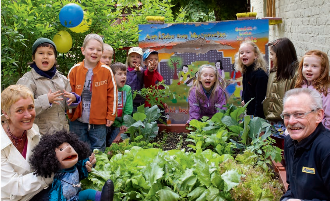
Kita in Berlin