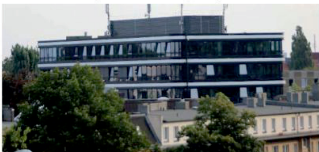
Im vierten Stockwerk des Technischen Rathauses befindet sich das Fachamt MR

Zum Fachbereich Betrieb, der allein ca. 100 Mitarbeiter beschäftigt, gehören das Schwanenwesen mit dem Schwanenvater Nieß, der Betriebshof und der gärtnerische Bereich, der auch über einen Steiger für Baumausschnitte verfügt. Für den Bereich Tiefbau werden auch Ausbesserungsarbeiten an Straßen durchgeführt. SF