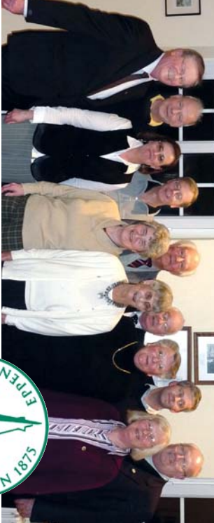
Der Vorstand 2011