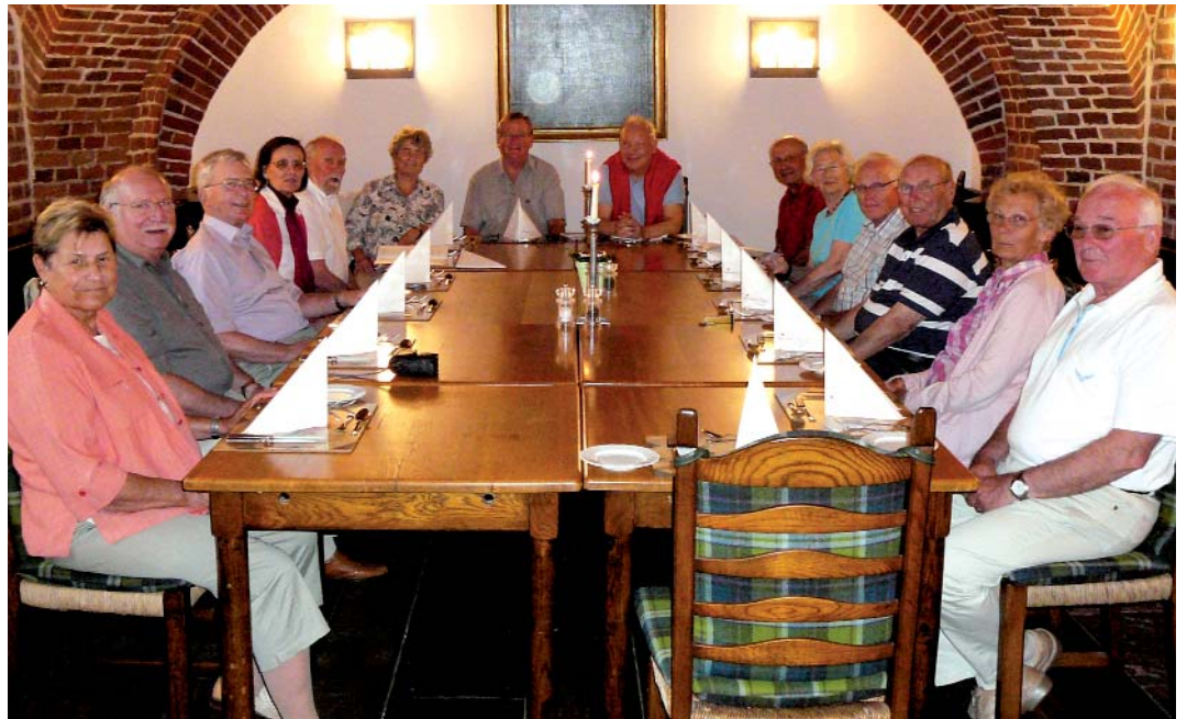
Die „Pedalritter“ des EBV in gemütlicher Runde

Wenn wir gewollt hätten, stünden uns ca. 100 verschiedene Schlösser und Burgen auf der Radtour durch das Münsterland zum Bestaunen und Besichtigen zur Verfügung.