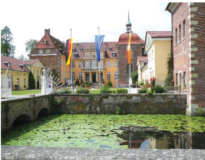
Hotel Sportschloss Velen - ein märchenhaftes Wasserschloss

reizvolle Kleinstadt Borken mit historischem Zentrum. Etwas ausserhalb des Ortes steht die Wasserburg-Gemen, die wir allerdings nur von außen besichtigen konnten. Hier ist eine Jugendbildungsstätte des Bistums Münster untergebracht.