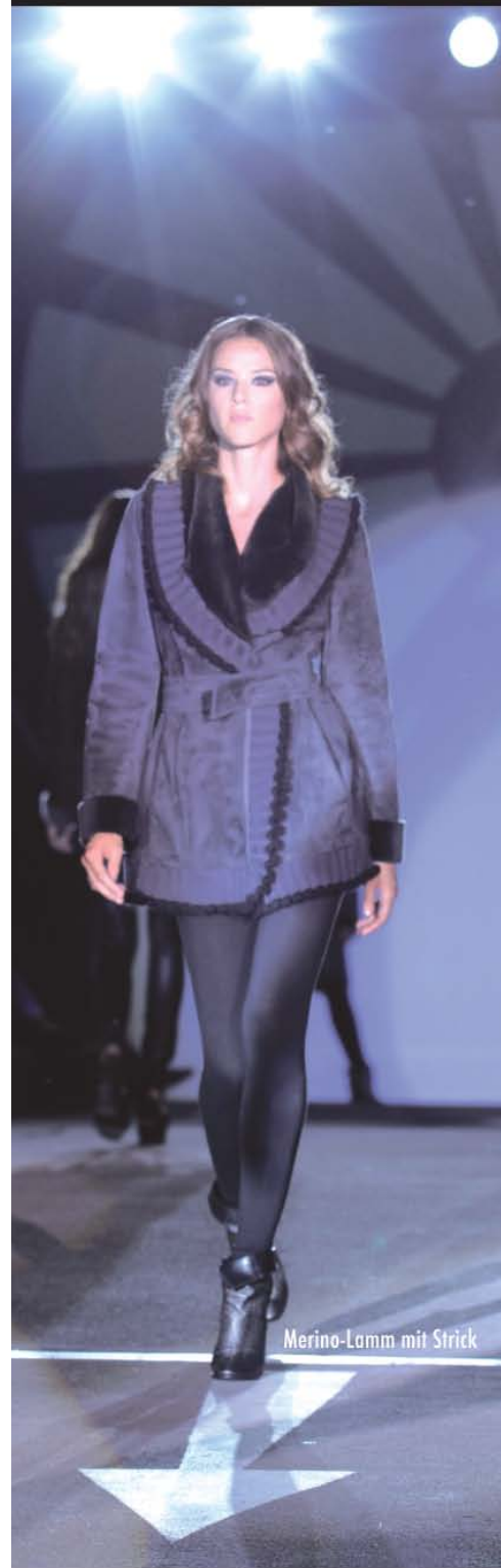
Merino-Lamm mit Strick