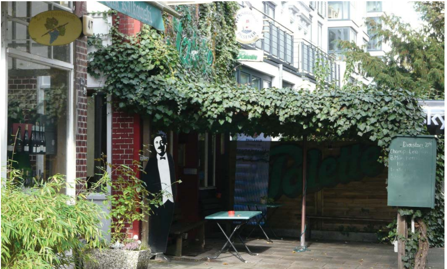
Ein idyllisches Plätzchen im Viertel.