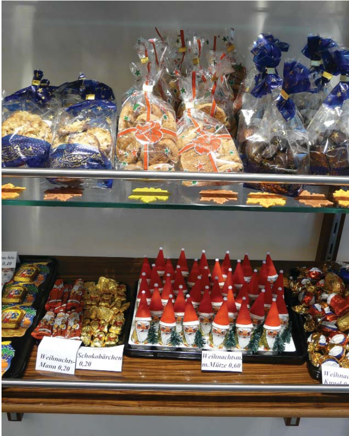
Auch im Viertel hat man sich schon auf Weihnachten vorbereitet.