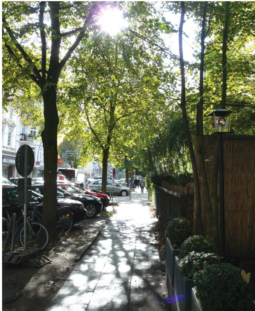
Viel Grün prägt das Erscheinungsbild der Strassenzüge im Eppendorfer Viertel.

Lokstedter Weg 9 / Ecke Erikastraße 20251 Hamburg – Eppendorf Tel.: 040 - 47 74 73 Fax 040 – 47 72 27