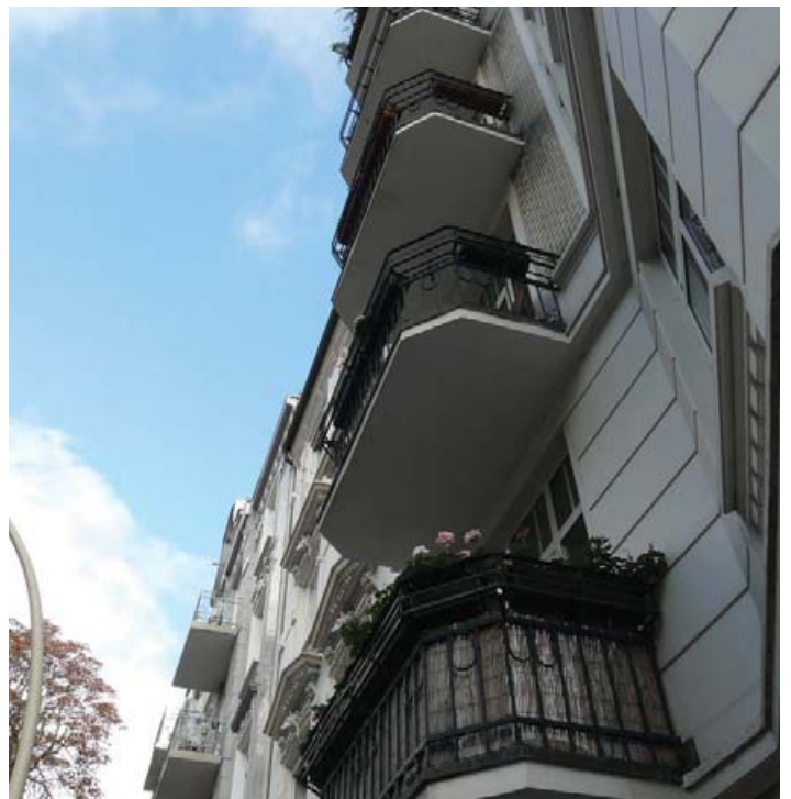
Unterschiedliche Baustile prägen das Strassenbild im Eppendorfer Viertel.