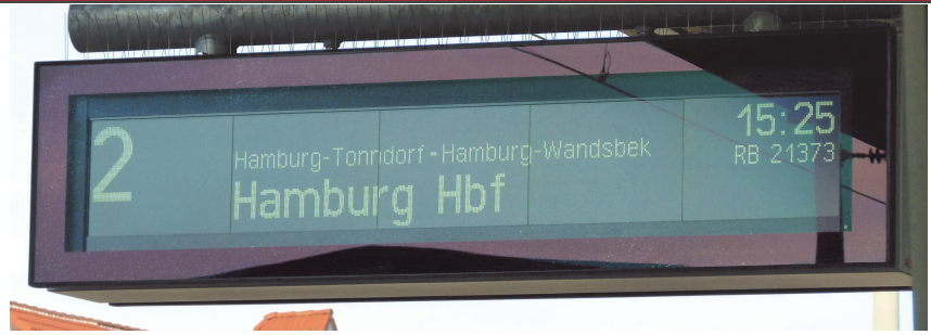
Die R10 sorgt für viel Frust und Ärger. Häufige Verspätungen oder sogar ganze Ausfälle von Zügen. Die S4 soll regelmäßiger und vor allem zuverlässiger fahren. In der Hauptverkehrszeit ist ein 10 Minuten Takt vorgesehen.

Der Bund hatte vor, eine Milliarden Euro für einen zweiten S-Bahn-Tunnel in München auszugeben. Die verfügbaren Mittel