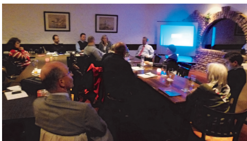
Die Besucher führten eine leidenschaftliche Diskussion über die Eurorettung

Die FDP Rahlstedt lud zusammen mit der Bundestagsabgeordneten Sylvia Canel zu einem öffentlichen Informationsabend mit dem Thema „Europa - Unbezahlbar?“ ein. Im Café Olé erfuhren die rund 15 Anwesenden nicht nur vieles über die aktuelle