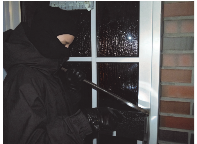
Erhöhte Einbruchgefahr in den dunklen Jahreszeiten

Bei Fragen hierzu oder anderen Themen erreichen Sie uns montags bis freitags von 9.00 bis 13.00 Uhr unter 679 27 04. (js)