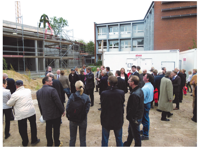
Das Richtfest der Mehrzweckhalle in Rahlstedt lockte viele Besucher an.

Auch wir Meiendorfer können uns schon auf die Halle freuen, die dann bequem mit den Buslinien 24 oder 275 zu erreichen ist.