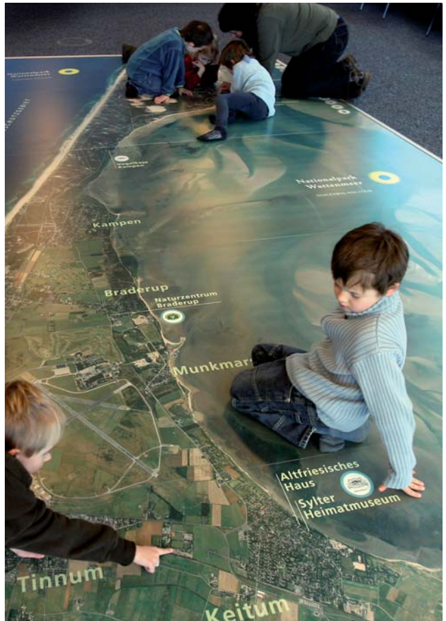
Ein paar kleine Schritte von Hörnum nach List: Sylt als Bodenbelag der besonderen Art.

Welche Strategien Tiere und Pflanzen im Nationalpark Wattenmeer entwickelt haben, um mit den Naturgewalten leben zu können, erfährt der Besucher im Bereich „Leben mit Naturgewalten“. Beim Gang durch einen überdimensional großen Watttunnel erlebt man die Welt der Wattbewohner. Aber auch das Leben der Schweinswale, Kegelrobben und vieler anderer Tiere und Pflanzen wird hier unter die Lupe genommen, im Dunkelraum lässt sich z. B. das Fluoreszieren echter Quallen beobachten.