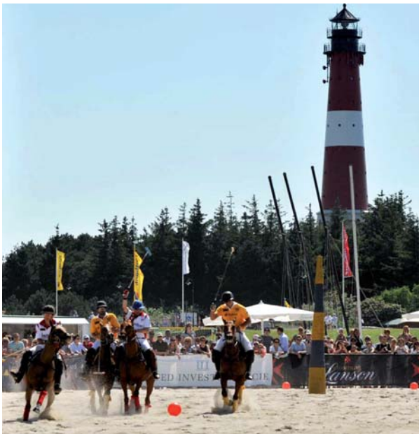
Polo on the Beach: Zu Pfingsten kämpfen die mutigen Reiter auf spritzigen Ponys an Hörnums Strand.

Das hat Weltklassequalität! Diese Tatsache hat sich in den internationalen Kreisen des königlichen Mannschaftssports herumgesprochen. Dass es auf der Insel so toll ist, ein fantastisches Publikum die Spiele begleitet, dass der ganze Rahmen der German Polo Masters einfach stimmig für die ganze Familie ist. Das hatte zur Folge, dass Organisatorin Kiki Schneider immer mehr Spitzenspieler, zum Teil in Begleitung der ganzen Familie, zum Kampf um den Sal. Oppenheim Gold Cup begrüßen kann und bei dieser 13. Veranstaltung zu acht spannenden Turniertagen lädt anstelle der bisher zwei Wochenenden. Acht High-Goal-Teams, Meister der Königsklasse, bringen rund 200 ihrer rassigen Pferde mit auf die Insel, Garant für mitreißende Kampfszenen auf Keitums grüner Wiese. In