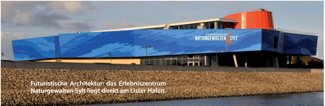
Futuristische Architektur: das Erlebniszentrum Naturgewalten Sylt liegt direkt am Lister Hafen.