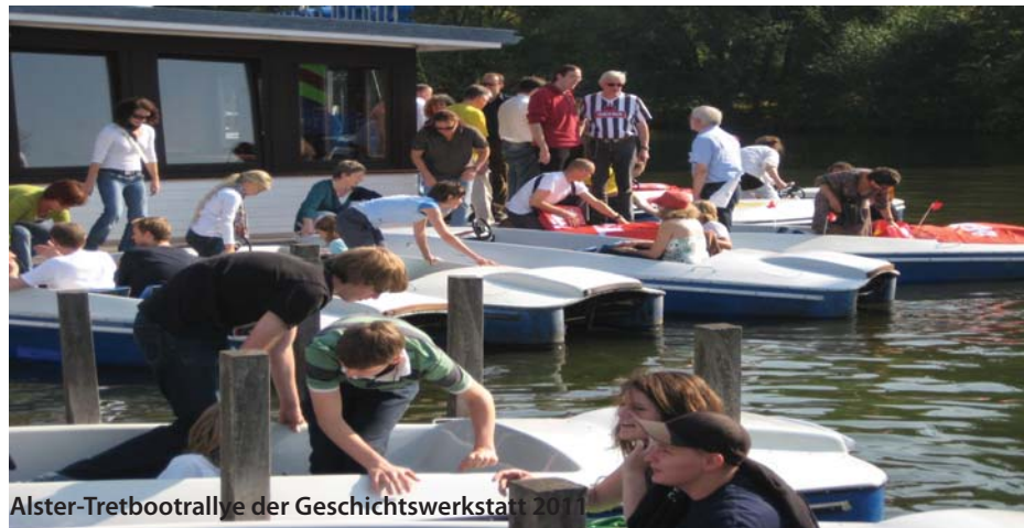
Alster-Tretbootrallye der Geschichtswerkstatt 2011

Die Startgebühr pro Team beträgt 10 Euro, die vierköpfigen Teams sollten möglichst umgehend bei der Geschichtswerkstatt gemeldet werden (info@gw-stgeorg.de, Tel. 571 38 636). Für Imbiss und