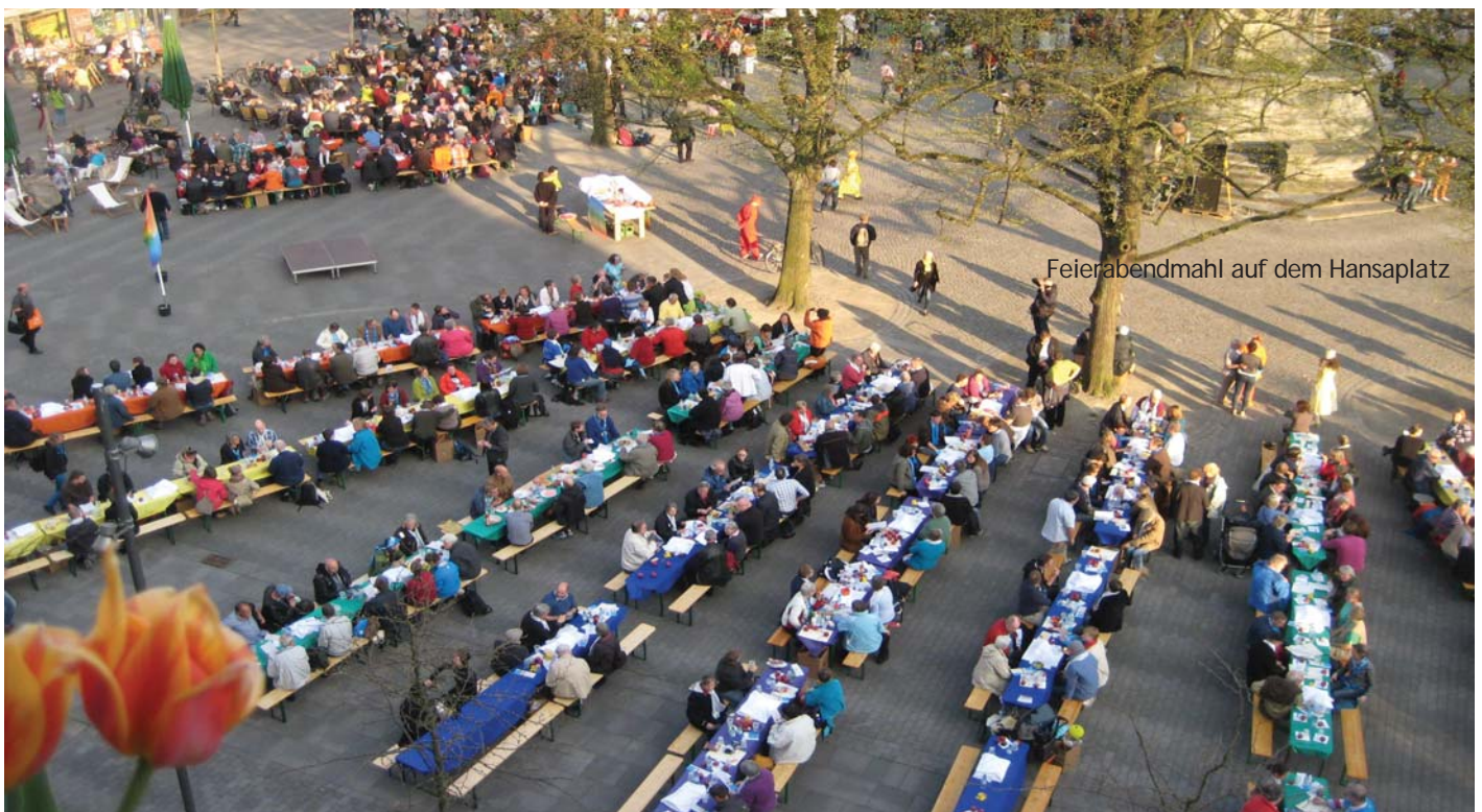
Feierabendmahl auf dem Hansaplatz