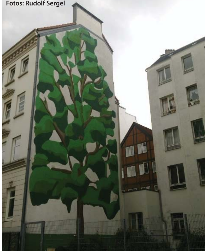
Baum als Wanddeko St. Georg: kann Funktionen eines Baumes nicht ersetzen

Die ehemalige „Umwelthauptstadt“ erweist sich hier wieder einmal als wenig stadtkologisch orientiert, und ihre PlanerInnen als wenig sachkompetent, was leider auch nichts Neues ist. Heute geforderte ökologische Stadtplanung ist etwas anderes als Planwünsche der Handelskammer zum innerstädtischen Bereich unkritisch zu übernehmen. (Rudolf Sergel, Sprecher des Arbeitskreises Biodiversität des BUND Hamburg und Mitgründer der Projektgruppe Stadtnatur Hamburg) ■