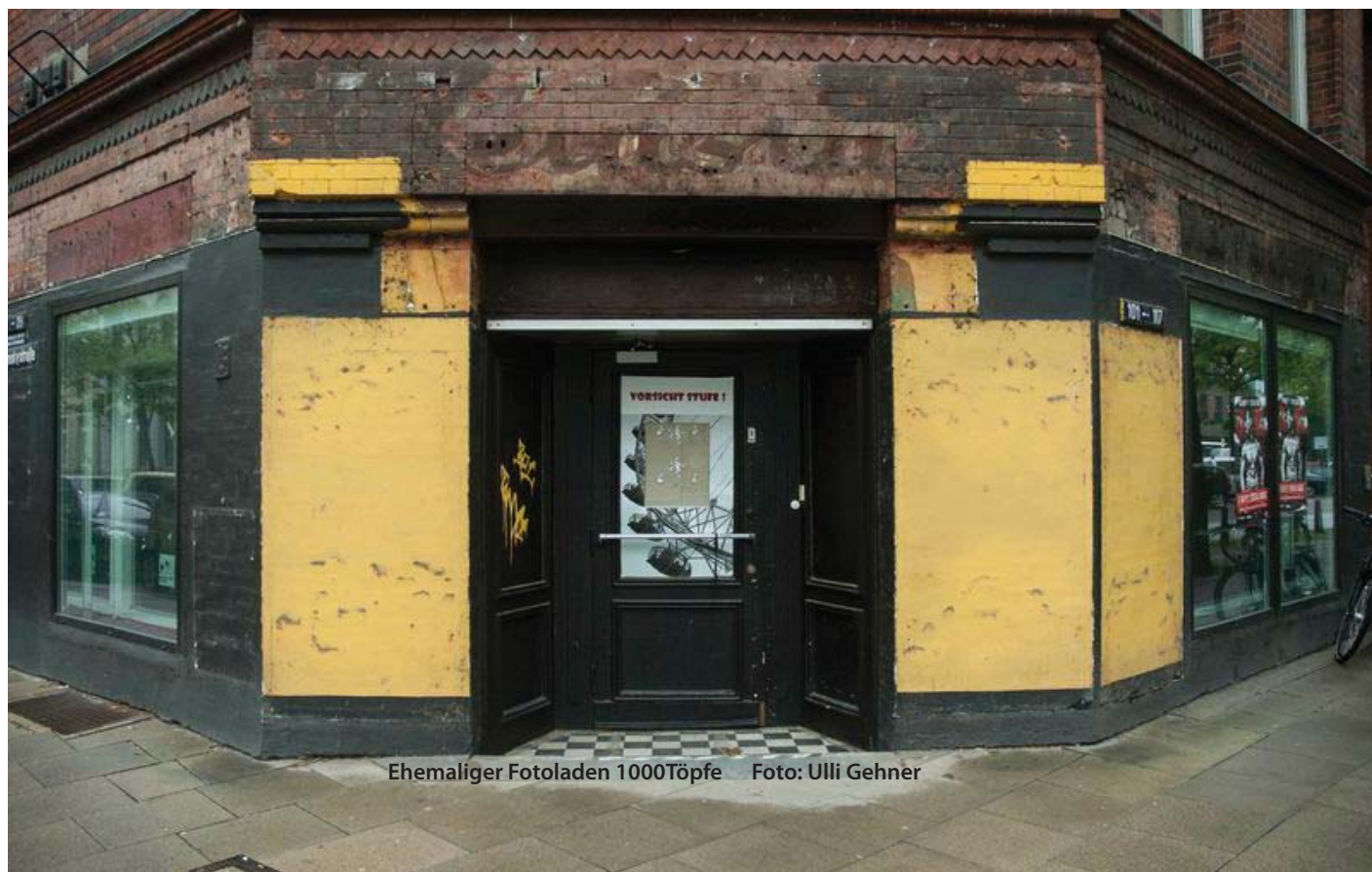
Ehemaliger Fotoladen 1000Töpfe

Doch sehr optimistisch kann man nicht sein. Alle vom Stadtteilbeirat Ende Februar erhobenen Forderungen, z.B. im Bebauungsplan für die Lange Reihe neue Schank- und Speisewirtschaften nur noch „ausnahmsweise“ zuzulassen oder für eine Senatsinitiative einzutreten, in das Baugesetzbuch auch die „Erhaltung der Verbrauchernahen Versorgung der Bevölkerung“ aufzunehmen, wurden vom Fachamt für Stadt- und Landschaftplanung in einer Empfehlung vom 5. April entweder auf die ganz lange Bank verschoben oder gleich abgelehnt („nicht weiterzuverfolgen“). Sie wollen's eben einfach nicht. ■