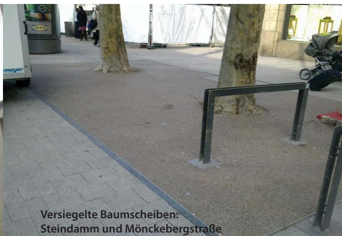
Versiegelte Baumscheiben: Steindamm und Mönckebergstraße