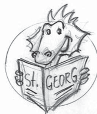
Zeichnung: George Riemann

bindliches Ziel ist eine sozial gerechte, klimaverträgliche und demokratisch kontrollierte Energieversorgung aus erneuerbaren Energien.“ ■