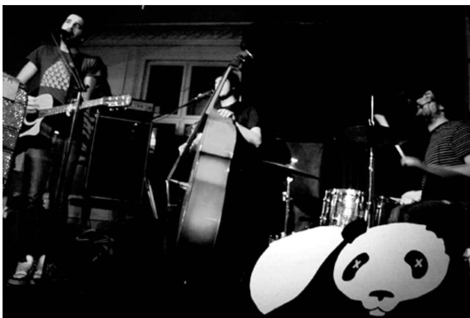
Links und auf Seite 16: The Calorifer is Very Hot!

Dorian Gray: Die Musik und die Texte, die sie begleiten, dienen auch der Förderung der Phantasie. Sie erschafft eine utopische Welt, die auch ein mögliches Modell für eine Welt sein könnte. In Italien wird am ehesten das Übertragen dieser Phantasie in ein mög-