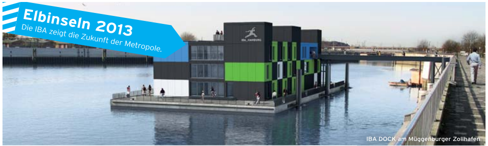
IBA DOCK am Müggenburger Zollhafen