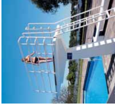
Baden mit wunderschönem Blick auf die Elbe

einen Sprung ins kühle Nass steht ein Sprungturm mit 1 m und 3 m Sprungbrett zur Verfügung. Für sportliche Aktivitäten außerhalb der Schwimmbecken sorgen ein Beachvolleyballfeld und eine Tischtennisplatte. Für die kleinsten Gäste gibt es das Kinderplanschbecken. Auch für das leibliche Wohl ist gesorgt.