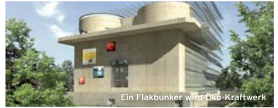
Ein Flakbunker wird Öko-Kraftwerk