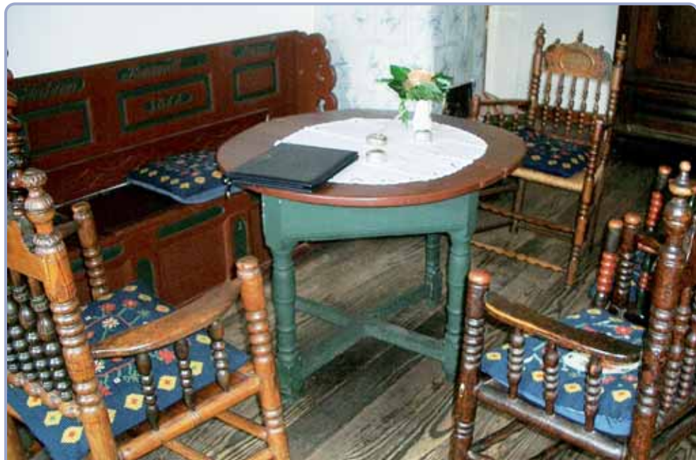
Trauzimmer des Wilhelmsburger Amtshauses