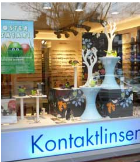
Grüne Ostereier im Schaufenster von Lühr-Optik während der Ostersafari.

Die Gewinner wurden per Post benachrichtigt. Für alle, die dieses Jahr nicht gewonnen oder die Ostersafari verpasst haben: Für 2013 ist wieder eine Ostersafari geplant!