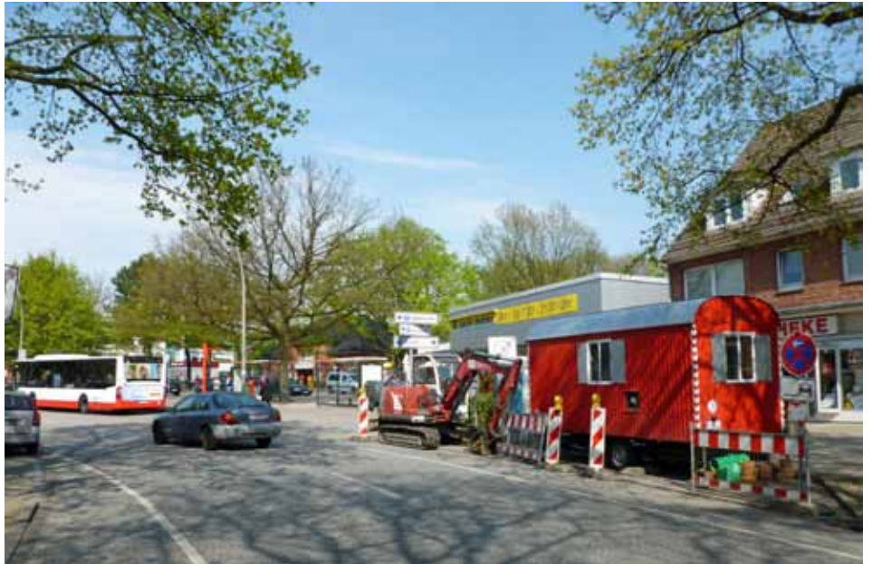
Im Mai begannen die vorbereitenden Arbeiten zum Umbau.

Die Planungen in der Übersicht können Sie dem Plan auf der gegenüberliegenden Seite entnehmen.