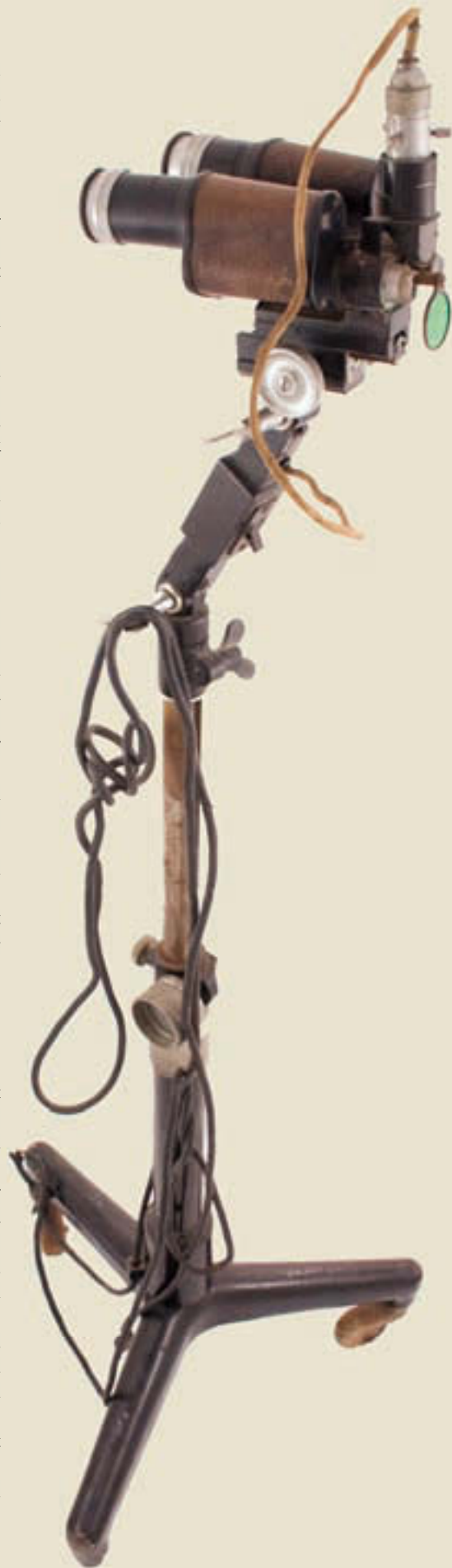
Als der Frauenarzt Prof. Dr. Hans Hinselmann 1949 aus der Haft entlassen wurde, verkaufte er dieses Gerät mit dem Hinweis, dieses sei das erste funktionsfähige Kolposkop der Welt und verfüge damit über einen gewissen Wert

E-Mail: veroeffentlichung.huebner@yahoo.de