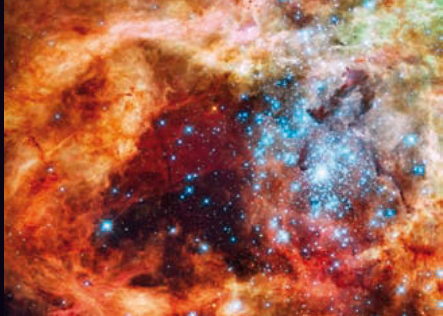
Die mit dem Weltraumteleskop „Hubble“ gemachte Aufnahme zeigt hunderte blau strahlende Sterne, die »größte stellare Kinderstube« unserer galaktischen Nachbarschaft

tronisch sichtbar sind, zwei weitere simultane Lichtblitze folgen. So weit so gut. Das Problem war allerdings, dass beide simultane Lichtblitze zum absoluten Nachweis, dass sie tatsächlich von einer Neutrino-Interaktion stammten, nur einen Abstand von acht millionstel Sekunden voneinander haben durften.