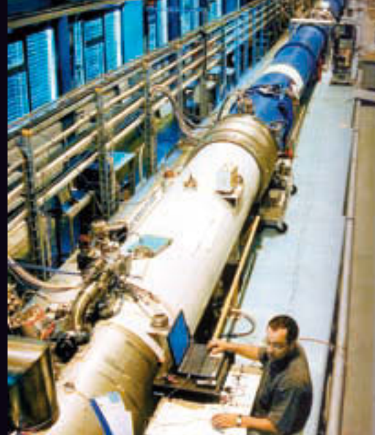
Teilansicht des kilometerlangen Protonenbeschleunigers, der am CERN den Neutrinostrahl erzeugt

Ende September 2011 lasen sich Medienberichte so, als seien ein intergalaktischer Tourismus und Tagesreisen in die erdgeschichtliche Vergangenheit zur Beobachtung von „lebenden“ Dinosauriern schon in naher Zukunft möglich. Ursache war eine gemeinsame Mitteilung des Kernforschungszentrums CERN bei Genf und der Laboratori Nazionali del Gran Sasso nordöstlich von Rom über Experimente mit Neutrinos, welche die millionenfach bewährte Relativitätstheorie Einsteins in Frage stellte. Neutrinos sind kleinste Elementarteilchen, die in größter Anzahl nahezu unnachweisbar das gesamte Universum ausfüllen. Die Protonenbeschleuniger vom CERN, mit denen sie erzeugt werden, sind Teil der größten technischen Maschine, die jemals gebaut wurde. Der Teilchendetektor, mit dem sie nachgewiesen werden, befindet sich 1.500 Meter unter dem Gran Sasso Massiv und ist der größte seiner Art. Ein erstaunlicher Gegensatz: Die größten elektronischen Anlagen der Welt sind nötig, um die kleinsten Elementarteilchen im Universum zu erzeugen und nachzuweisen! Die Kernaussage, der über Jahre durchgeführten Experimente war, dass Neutrinos, die 730 Kilometer lange unterirdische Strecke von Genf zum Gran Sasso, einige milliardstel Sekunden schneller zurückgelegt haben, als das Licht für die gleiche Strecke gebraucht hätte. Neutrinos sind demnach schneller als das Licht.