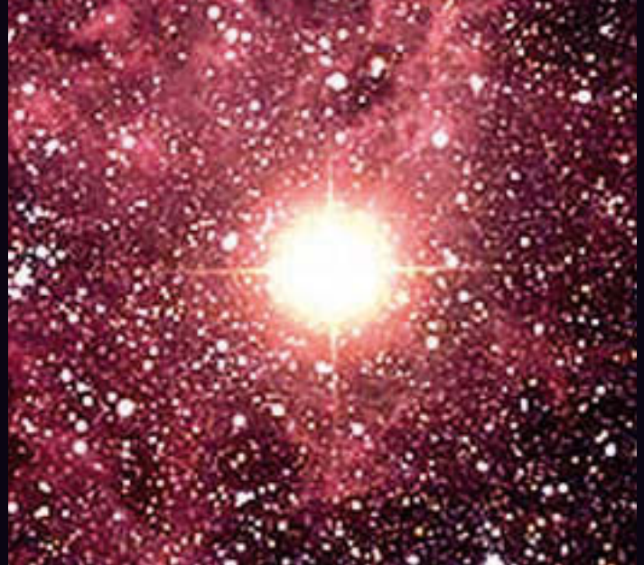
Die Große Magellansche Wolke einen Tag später am 23. Februar 1987. Die Supernova überstrahlt an Helligkeit die gesamte Galaxie. Neutrinos und Licht machten sich vor 168.000 Jahren auf die Reise zur Erde

An dieser Stelle durchschlägt der junge Einstein, logisch konsequent, den Gordischen Knoten: Es gibt keine absolute Zeit, die Zeit ist relativ und läuft folglich in bewegten Systemen langsamer ab, als in ruhenden. Einstein konnte sogar diesen Zeitunterschied bestimmen, indem er den Satz des Pythagoras auf das rechtwinklige Dreieck A B C anwendet: (c \times t_{\text{ruh}})^2 + (v \times t_{\text{bew}})^2 = (c \times t_{\text{bew}})^2 und auflöst nach: t_{\text{bew}} = t_{\text{ruh}} \sqrt{1 - v^2/c^2} .