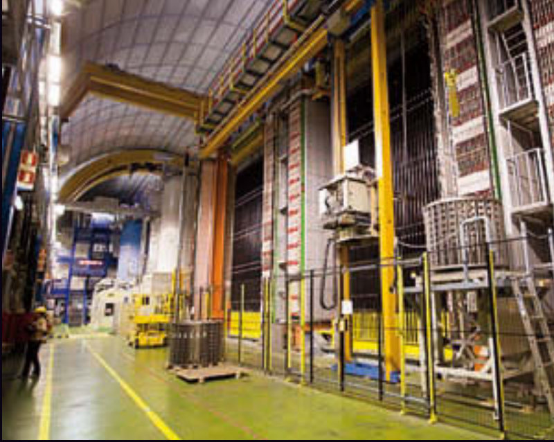
Der haushohe, aus tausenden von Bleiziegeln aufgebaute Neutrinodetektor unter dem Zentralmassiv des Gran Sasso.