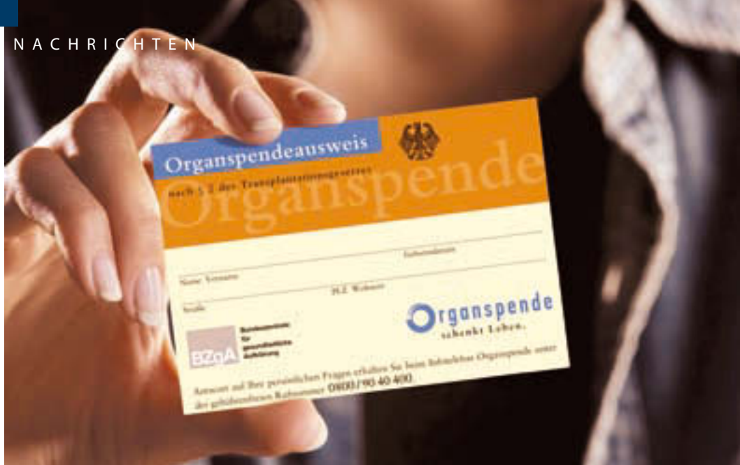
Immer noch haben zu wenig Menschen einen Organspendeausweis