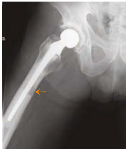
Abb. 1: Beckenübersicht: Isolierte Femurschaftosteolyse bei festsitzender, zementierter Schaftendoprothese rechts (← Lysezona)