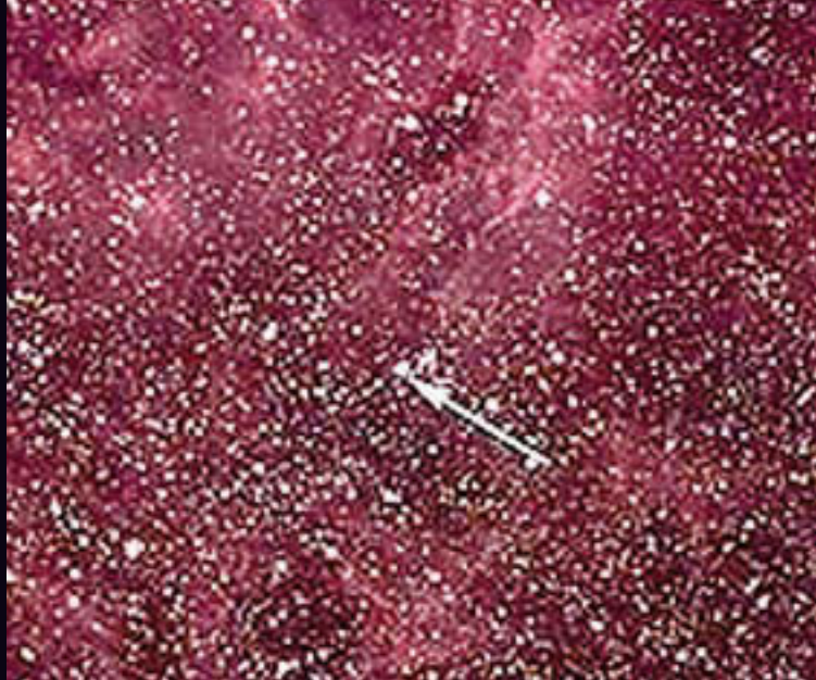
Die Große Magellansche Wolke am 22. Februar 1987. Der Pfeil zeigt auf den kaum sichtbaren, noch nicht explodierten Stern