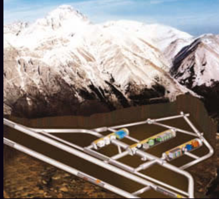
Modell der unterirdischen Anlage der Laboratori Nazionali del Gran Sasso in Assergi

Anfang des 20. Jahrhunderts stieß man bei der Untersuchung von radioaktiven Zerfallsprozessen auf ein merkwürdiges Phänomen. Beim Zerfall eines radioaktiven Elements wird die Energiedifferenz in Form von radioaktiver \beta -Strahlung abgegeben. Bei dieser Strahlung werden Elektronen aus dem zerfallenden Kern geschleudert. Das Energiespektrum dieser Elektronen war aber immer geringer, als es nach der Energieberechnung des \beta -Zerfalls zu erwarten gewesen wäre. Einige der hervorragendsten Physiker, beispielsweise Ernest Rutherford, der Entdecker des Atomkerns und der \beta -Strahlung, oder Enrico Fermi, der Erforscher der \beta -Strahlung, waren sogar bereit, dafür zwei der „heiligsten“ Grundsätze der gesamten Physik, Energieerhaltungs- und Impulserhaltungssatz, zu opfern. Dies galt jedoch nicht für einen genialen Physikstudenten, der 1921 als 21-jähriger im dritten Semester den 230 Seiten langen Artikel über die Relativitätstheorie für die Encyclopädie der Mathematischen Wissenschaften geschrieben hatte. Der Name dieses Genies: Wolfgang Pauli.