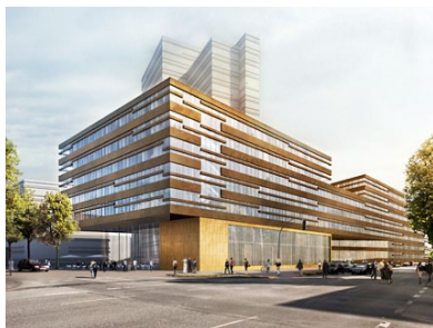
Der Siegerentwurf eines künftigen Campusgebäudes in der Bundesstraße.