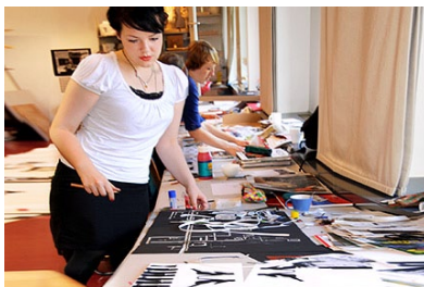
Eine Teilnehmerin beim Collage-Workshop.