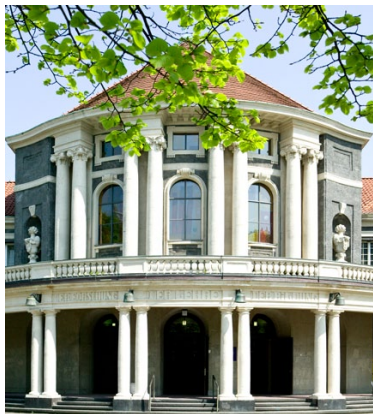
Das Hauptgebäude der Universität