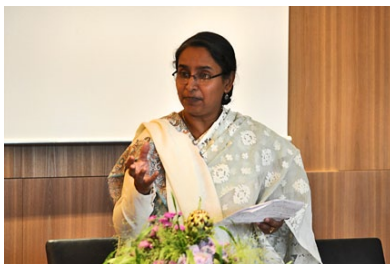
Dr. Dipu Moni sprach im Saal des Akademischen Senats über die Bedeutung von Bildung in ihrem Land.