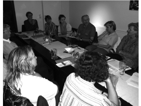
Bürgertreff im Schrebers