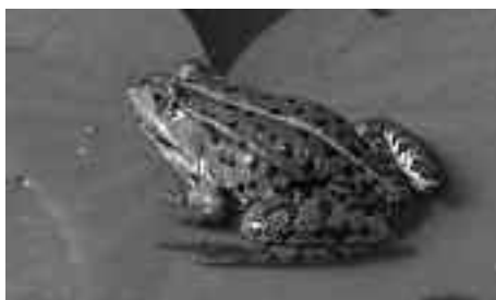
In Hamburg gefährdete und nur noch in wenigen Populationen lebende Art: der Seefrosch ( Rana ridibunda ) wurde auf dem Gelände des Altspülfeldes Kirchsteinbek nachgewiesen.

Ein ausgewiesenes Naturschutzgebiet liegt im Bereich Billstedt-Horn nicht, jedoch grenzt mit der Boberger Niederung ein wertvolles Naturschutzgebiet unmittelbar südöstlich an den Entwicklungsraum. Und in Billstedt-Horn sind Vorkommen verschiedener bedrohter und in Hamburg seltenerer Arten von Tieren und Pflanzen beschrieben. Als Beispiele können etwa Sumpf-Gänsedistel, Moor- und Seefrosch, Drosselrohrsänger, Waldohreule, Rohrwei-