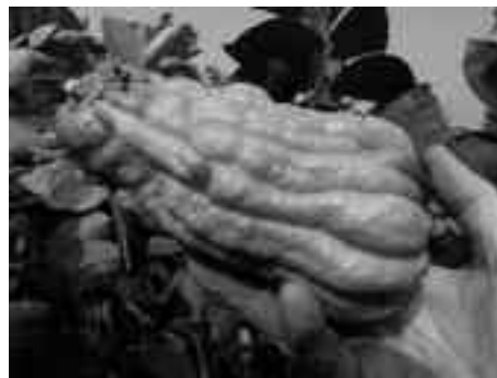
Merkwürdige Zitrusfrucht: Die Hand Buddhas

Redaktionsschluss für Ausgabe 4/09: 6. 7. 2009