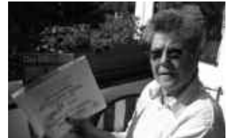
Die Preisrätselgewinnerin auf ihrem sonnigen Südbalkon

Senden Sie Ihre Antwort bitte an die Redaktion ( nicht an die Geschäftsstelle). Die Verbindungsdaten stehen im Impressum auf der Seite 2