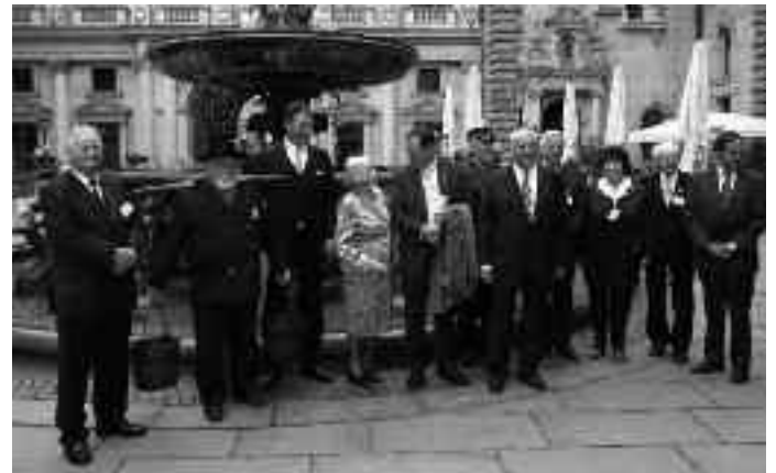
Alle diesjährigen Preisträger im Innenhof des Rathauses