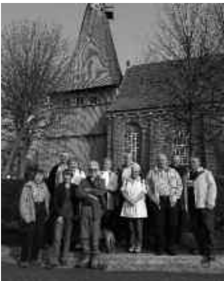
An der Estebrügger Kirche war Wanderstart