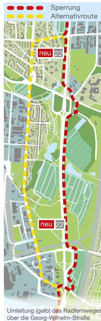
Umleitung (gelb) des Radfernwegs über die Georg-Wilhelm-Straße

komfortabler zu gestalten, wird im Herbst an der Westseite der Georg-Wilhelm-Straße ein Schutzstreifen für Radfahrer mit einer Breite von ca. 1,5 Metern auf der Straße eingerichtet. Der feste Radweg an der Ostseite bleibt bestehen. Zusätzlich wird die Ausschilde- rung der Umleitung lückenlos hergerichtet. Auch wenn der Weg für Radfahrer damit zunächst etwas länger bleibt, so bedeutet dies doch entscheidend mehr Sicherheit.