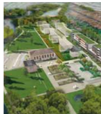
Im Gebiet rund um den Schlöperstieg nehmen die Bauarbeiten Fahrt auf.

Kauf nehmen. Der Weg in der Verlängerung des Schlöper- stiegs bis zur Brücke über die Kornweidenwettern ist bis zum September dieses Jahres ge- sperrt, ebenso ab April der Kü- kenbracksweg. Umleitungen über die Peter-Beenck-Straße und über die Straße Kuckuckshorn sind ausgeschildert.