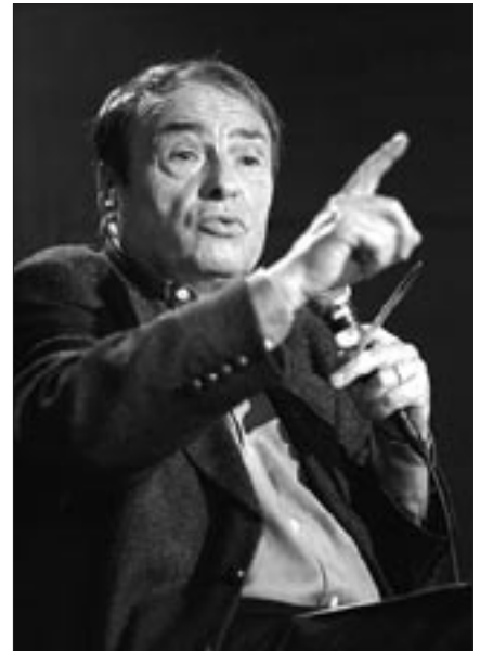
Pierre Bourdieu

Wir wollen vorerst nicht mehr, als zum Nachdenken über eine