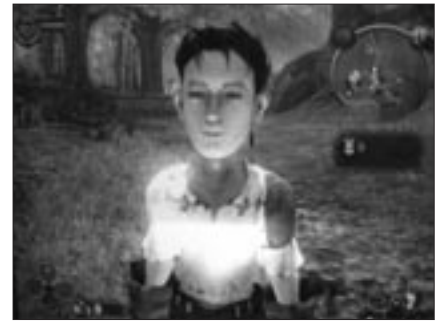
Abb. 1: Der Avatar in Fable als Kind, ...

Was ist nun mit der narrativen Struktur von Videospiele gemeint? Mit dem Begriff der narrativen Struktur wird bereits in der klassischen Narratologie der sechziger und siebziger Jahre sowohl eine abstrakte, zugrunde liegende Handlungsstruktur als auch deren Vermittlung bezeichnet (vgl. Gülich/Raible 1977, S. 193 f.). Hier soll allerdings nicht versucht werden, die Vermittlungsbzw. Darstellungsebene von Videospiele mit Hilfe narratologischer Theoriebestände zu beschreiben (vgl. aber Neitzel 2000, S. 110 ff.). Vielmehr werden narrative Strukturen als zum Zeitpunkt ihrer (wie auch immer gearteten) Darstellung bzw. Rezeption bereits determinierte Strukturen, die prinzipiell in einer Vielzahl verschiedener Medien dargestellt werden können, verstanden: „Wer narrative Texte liest, tut etwas scheinbar Paradoxes, denn er nimmt das dargestellte Geschehen zugleich als offen und gegenwärtig und als abgeschlossen und vergangen auf“ (Martinez/Scheffel 1999, S. 119). Anhand dieser Prädeterminiertheit lassen sich narrative Strukturen auch recht deutlich von ludischen Strukturen abgrenzen. So weist etwa ein im Rahmen eines Videospiele simuliertes Fußballspiel keine narrative Struktur auf, da (und nur insofern) der Spielverlauf nicht von vornherein