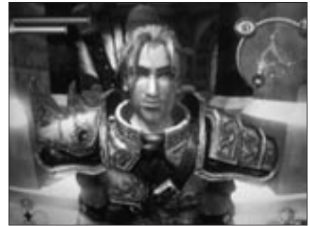
Abb. 2: als „guter“ Held ...