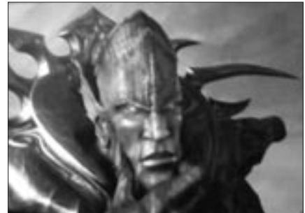
Abb. 6: Der Herrscher der Dämonen aus Warcraft III ...

Abschließend bleibt festzustellen, dass zwar keineswegs in allen Spielen Strukturen des Entwicklungsromans zu finden sind, sich aber unter der von den virtuellen Geschichten der Videospiele zitierten Literatur eben auch der Entwicklungsroman befindet – neben dem Organisationsprinzip der (mythischen) Heldenreise, den Genres der Science-Fiction und der Fantasy und so mancherlei mehr. Besonders interessant ist hierbei, dass sich im 21. Jahrhundert nicht nur die narrativen Strukturen in einem traditionell narrativen Genre wie dem Rollenspiel ausdifferenzieren, indem etwa vermehrt die moralische Entwicklung einer zentralen Heldenfigur thematisiert wird, sondern zunehmend narrative wie ludische Strukturen (etwa aus dem Rollenspiel) auch auf andere Genres übertragen werden. Diese sich wohl noch in der Anfangsphase befindliche Entwicklung führt dann etwa bei den 2000 und 2003 erschienenen Deus Ex -Teilen zu Ego-Shootern mit einem Avatar, dessen Fähigkeiten sich entwickelt und einer recht ansprechenden, nonlinearen Geschichte, die freilich nach wie vor nur die Rahmenhandlung für die Action der ludischen Strukturen bildet. Auch in dem 2002 veröffentlichten Aufbaustrategiespiel WarCraft III finden sich sowohl Heldenfiguren, deren Fähigkeiten sich im Laufe des Spiels entwickeln, als auch die Thematisierung von moralischer Entwicklung in Form des vom Spieler gesteuerten Prinz Arthas, der, von Machthunger