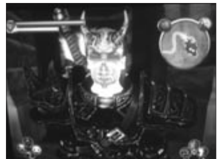
Abb. 3: und als „böser“ Schurke.

feststeht. Gleiches gilt für ein reales Fußballspiel: Für die meisten Fußballfans verliert eine Aufzeichnung eines solchen im Vergleich zu einer Live-Übertragung ganz erheblich an Reiz. Allein das Vorhandensein einer Reihe von Ereignissen ist also nicht genug, damit daraus eine Geschichte wird. Ein Fußballspiel kann (nach-)erzählt werden, wenn es vorüber ist und der während des Spiels offene Verlauf determiniert wurde. Die Elemente eines Fußballspiels (wie einer Fußballsimulation) haben aber selbst zunächst keine narrative Funktion. Diese spielhaften, nicht prädeterminierten und regelgeleiteten, meist actionhaltigen Elemente des Videospiele können als ludische Strukturen bezeichnet werden.