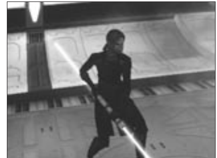
Abb. 5: und ihr „böses“ Gegenstück.

unser Held das Schwert, und seine befreite Schwester kommt zu ihm und stellt ihn vor die Wahl, entweder das Schwert zu zerstören oder sie zu töten, das Schwert zu behalten und der mächtigste Held auf der ganzen weiten Welt zu werden. Diese Entscheidung bildet den Endpunkt einer sich durch das gesamte Spiel ziehenden zweifachen Entwicklung, welche sich zum einen auf die ludische, zum anderen auf die narrative Struktur des Spielens bezieht. Bezogen auf die ludische Struktur ist die Entwicklung der Fähigkeiten des Avatars im Spielverlauf nichts anderes als die für den Entwicklungsroman typische „irreversible Folge von zunehmend komplexen Entwicklungsphasen, wobei jede höhere ‚Stufe‘ die vorhergehende voraussetzt“ (Mayer 1992, S. 13). Je mehr Erfahrung der Avatar etwa im Kämpfen oder Zaubern sammelt, desto besser werden seine entsprechenden, durch Stufen bezeichneten Fähigkeiten. Bezogen auf die narrative Struktur von Fable geht es in erster Linie um die moralische Entwicklung des Avatars. Je nach den Handlungen, die der Spieler den Avatar vollziehen lässt, entwickelt dieser eine „gute“ bzw. eine „böse“ Identität, was sich sowohl auf sein Erscheinungsbild als auch auf die Reaktionen der