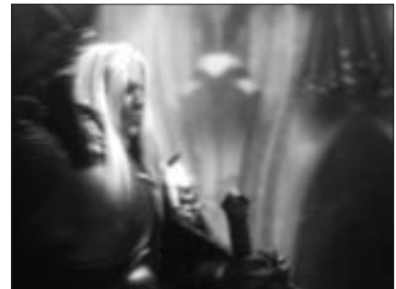
Abb. 7: und sein Diener, der seelenlose Prinz Arthas.