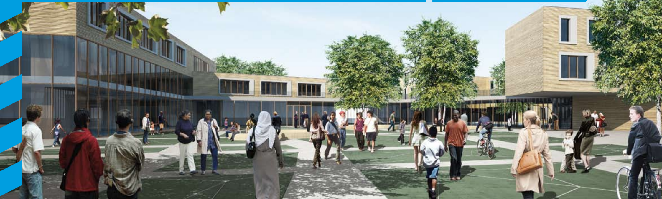
Blick auf den öffentlichen Platzbereich des geplanten Bildungszentrums „Tor zur Welt“