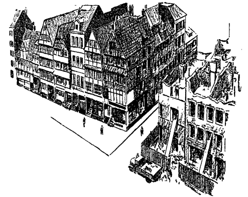
Eine Zeichnung, die den Abbruch der Häuser für das jetzige „Bressehaus“ vor dem Domplatz zeigt.

Und so kam es, daß vom Verlagshaus der Hamburger Nachrichten heute nichts mehr zu sehen ist. Und als vor kurzem der Nachfolger des früher auch zur Zeitung gehörenden Adreßbuchverlages, die Fa. Dumrath & Tafnath, nach einem Bild des Verlagsgebäudes suchte, da hat sie nur noch bei uns eins bekommen!