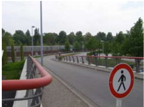
Radweg vom 1. Stock des Flughafens fehlt

Hinweis fehlt: links geht's zur S-Bahn Außerdem vergaß man, daß ein Radfahrer auch ins Erdgeschoß will. Der Radweg von der Ebene des 1. Stockes fehlt (Abb.!) Radfahrer müssen entweder einen Aufzug nehmen oder mit den sehr rajant fahrenden PKW auf die untere Ebene hinunterfahren.