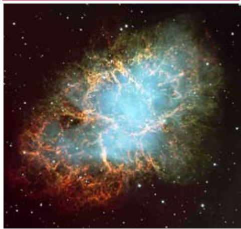
Abb.: Der Crab-Nebel

Was ist eigentlich die Religion der Zukunft? Wenn man heutige Menschen fragt, was sie als Religion verstehen, wird vielleicht gar nicht das richtige Wort gefunden werden, was die eigentliche Antwort gewesen wäre, sondern niemand wird es genau wissen. Dabei muß man gar nicht an irgendeine Sekte denken, die vielleicht gerade modern ist. Die eigentliche Religion, die vielen zwar vorschwebt, die sie aber nicht nennen würden, ist die, den idealen Partner im Leben zu finden und zu behalten, und das, was früher unter Frömmigkeit verstanden wird, das wird eher als Dienst und als Zusammenwirken mit diesem Partner verstanden werden.