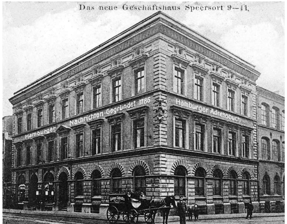
Das Geschäftshaus der „Hamburger Nachrichten“, Speersort 9-11