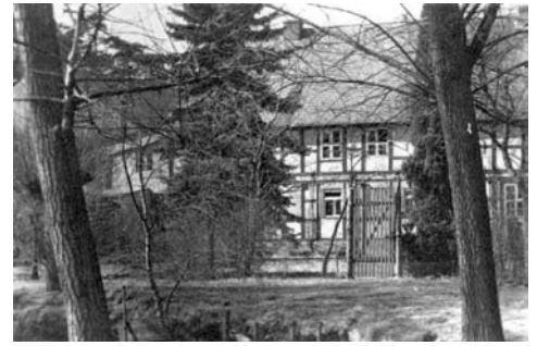
Die Kolonie Lenz 1948 (o.) und heute (u.)