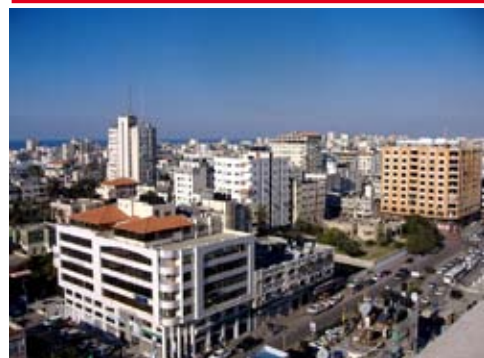
Anblick von Gaza-Stadt vor 2008

Zimmer wieder finden wir in den Nachrichten den Namen „Gaza“. Was weiß man eigentlich über die Vergangenheit dieser Stadt?