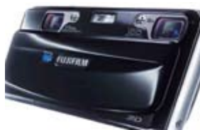
Neue Fujii-Kamera Finepix Real 3D