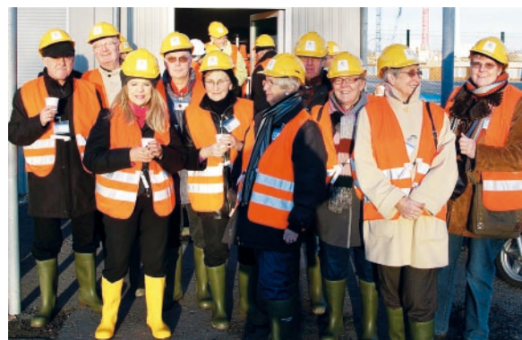
Die Fachgruppe Sicherheit und Verkehr auf der Baustelle in Moorburg

Der Beirat für Stadtmöblierung, in dem die Fachgruppe im Auftrag des LSB vertreten war, hat seine Arbeit erfolgreich beendet.