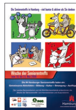
Das Plakat der Aktionswoche

Unter dem Motto „ Viel bunter & aktiver als Sie denken “ fand vom 19.-24. Mai erstmals eine „Woche der Seniorentreffs“ statt. Ein Großteil der über 80 öffentlich geförderten Seniorentreffs beteiligte sich und lud interessierte Ältere ein, die unterschiedlichsten Schnupperstunden wahrzunehmen. Kreative und kulturelle Kurse, Bildungsangebote, Bewegung und Gymnastik, Ausflüge und vieles mehr bewiesen, wie vielfältig das Angebot der Treffs ist, die damit eine sozialverbundene und präventive Lebensgestaltung im Alter