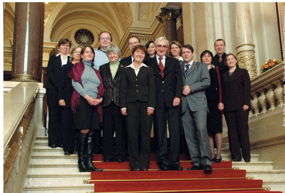
Der LUCAS-Beirat mit Senator Dietrich Wersich am 29. Oktober 2008 im Hamburger Rathaus

Der interdisziplinäre Forschungsverbund LUCAS wurde am 1. Oktober 2007 in der Metropolregion Hamburg gestartet. Federführend ist die gerontologische Forschungsabteilung des Albertinen-Hauses. Im wissenschaftlichen Beirat von LUCAS (Longitudinal Urban Cohort Ageing Study) ist der LSB mit seiner Landesvorsitzenden vertreten. In verschiedenen Arbeitsgruppen und mehreren Teilprojekten werden u. a. Strategien zur Gesundheitsförderung, zur Vermeidung von Krankheiten bzw. ihres Fortschreitens im Alter sowie zur Rehabilitation und pflegerischen Unterstützung erarbeitet. LUCAS wird vom Bundesministerium für Bildung und Forschung gefördert.