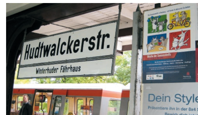
Das Werbeplakat auf einer U-Bahnstation im Mai 2008