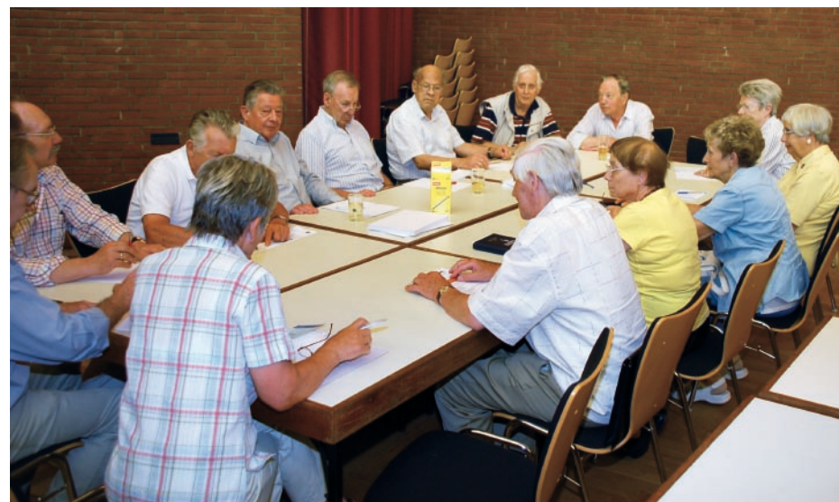
Die Arbeitsgruppe „Wohnen im Alter“ während der Vollversammlung am 2. Juli 2008