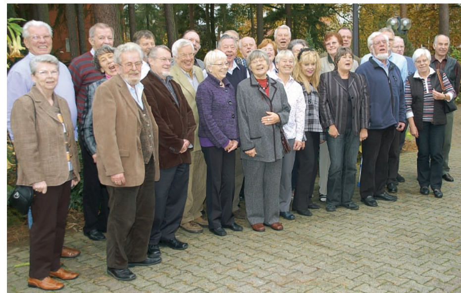
Teilnehmer/-innen des Seminars der Hamburger Seniorenbeiräte in Bad Bevensen im November 2008

Zum Abschluss des Seminars formulierte der LSB eine öffentliche Erklärung: Hamburgs Seniorenvertretung plädiert nachdrücklich für ein Umdenken in der Stadtplanung und Architektur. Ein größeres Angebot an barrierefreien Wohnungen ist dringend erforderlich. Auch sollten die Wohnungsbaugesellschaften bei Neu- und Umbauten vermehrt die Voraussetzungen schaffen, dass Wohngemeinschaften älterer Menschen möglich werden. Ebenso müssten die Zugänge zu den U- und S-Bahnhöfen schneller als bislang geplant barrierefrei ausgebaut werden.