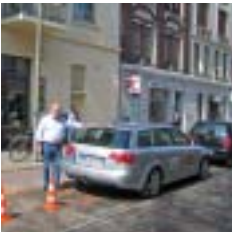
Die Freundlichen: Fahrschule Boom