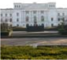
Planungsausschuss: Das neue Gremium