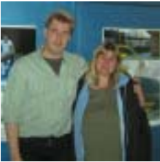
Die Enthusiasten: Zu Besuch im Lichtme-Kino