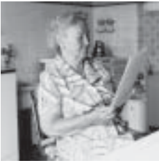
Kunst: Bodenvitrinen in der Zeitwiete