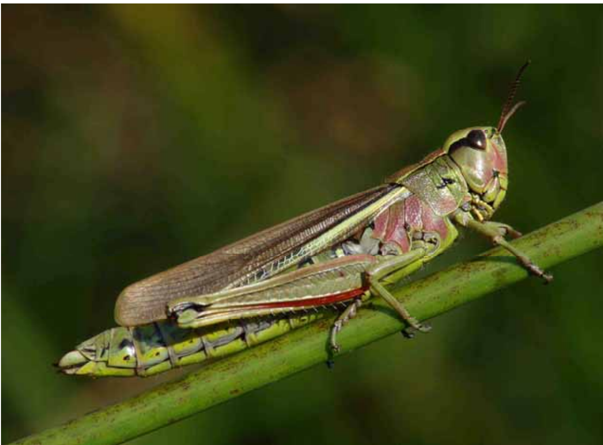
Sumpfschrecke ( Stethophyma grossum ), Weibchen