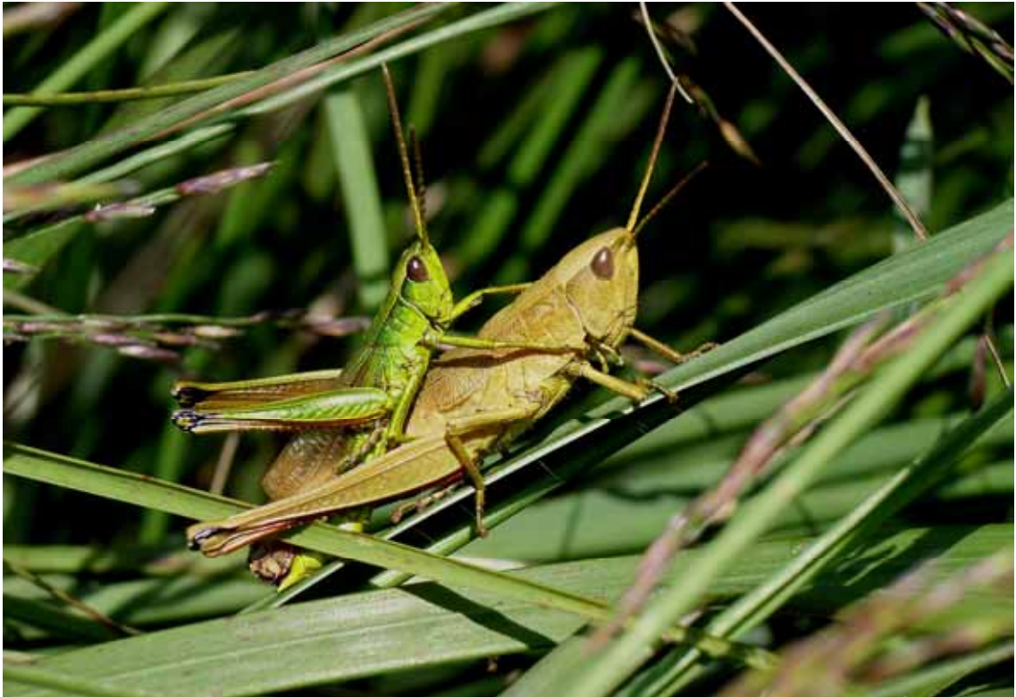
Chrysochraon dispar (Große Goldschrecke), Kopula