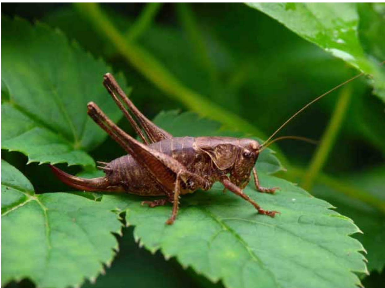
Gewöhnliche Strauchschrecke ( Pholidoptera griseoptera ), Weibchen