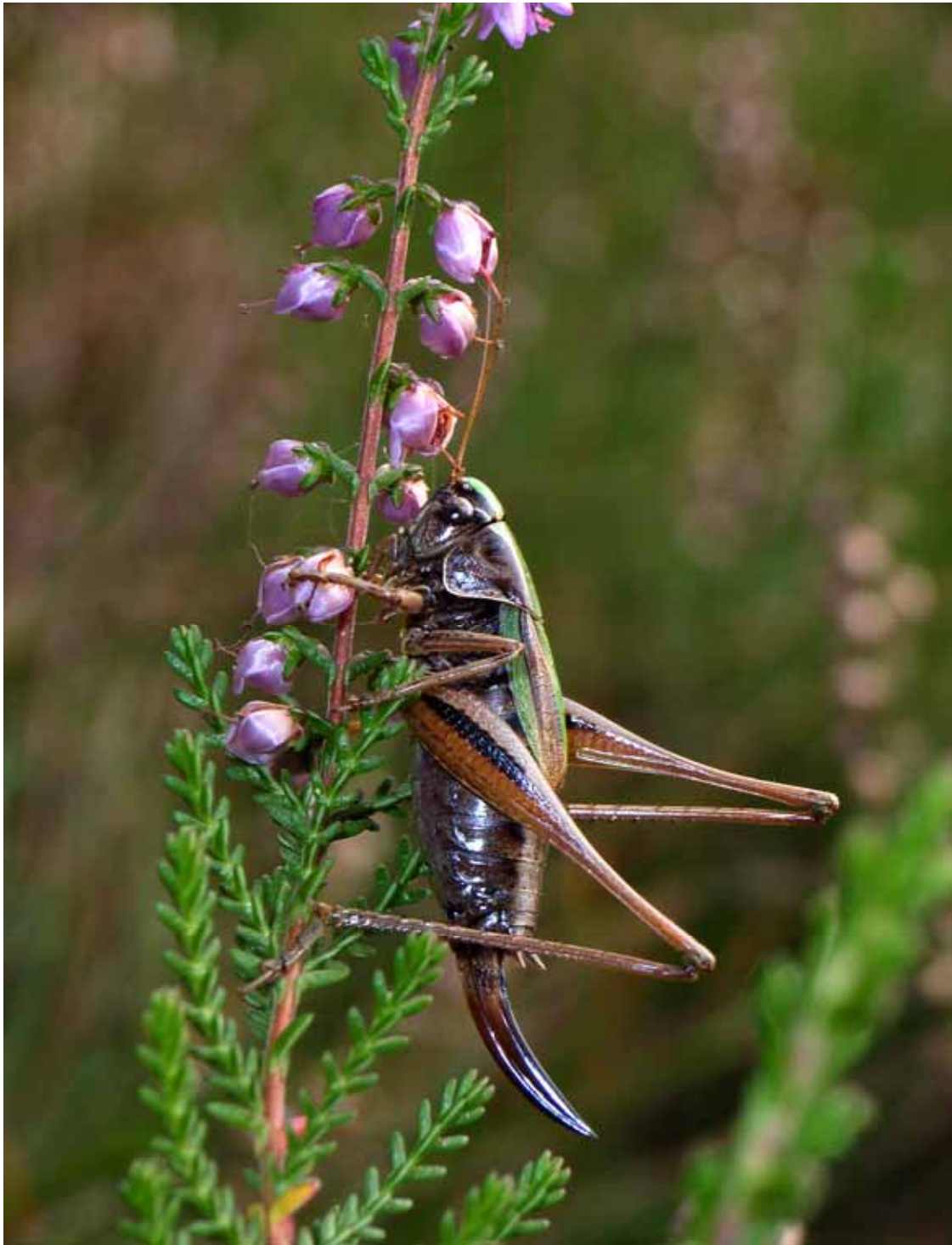
Kurzflügelige Beißschrecke ( Metrioptera brachyptera ), Weibchen