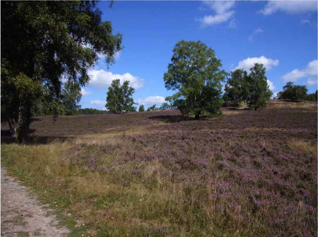
Fischbeker Heide: Lebensraum der Kurzflügeligen Beißschrecke ( Metrioptera brachyptera )