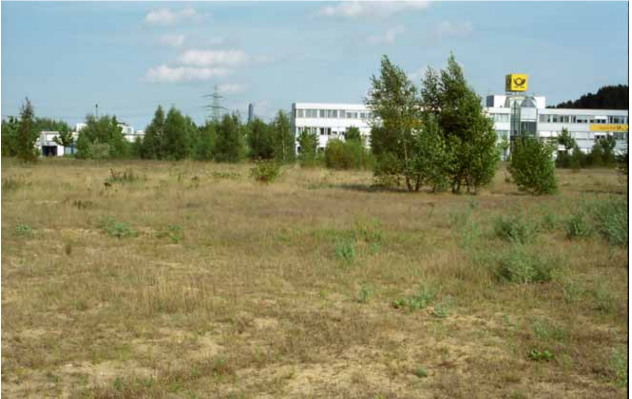
Gewerbegebiet Hausbruch: Lebensraum u.a. der Gefleckten Keulenschrecke