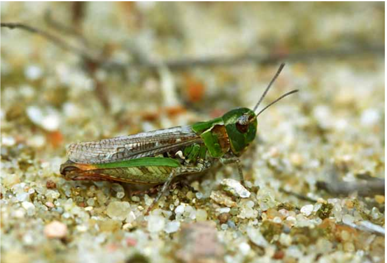
Myrmeleotettix maculatus (Gefleckte Keulenschrecke), Weibchen