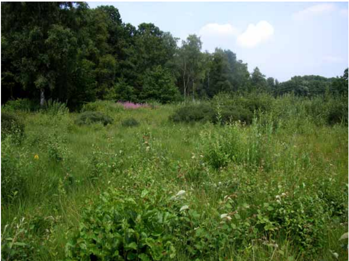
Eppendorfer Moor: Lebensraum der Großen Goldschrecke