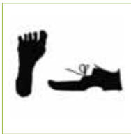
1. Fuß, Knochenzellen aufrütteln, 3000 Schritte