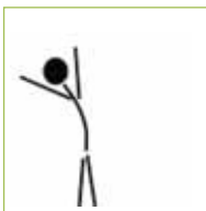
3. Dehnung Beine, Rumpf