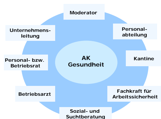
Abb. 1: Zusammensetzung des AK Gesundheit

Bei der Konstituierung des Arbeitskreises sollten wichtige Rahmenbedingungen diskutiert und festgehalten werden. Dazu gehören Vereinbarungen über die Arbeitsweise, über die Moderation (extern, intern), die Behandlung möglicher Konflikte usw.