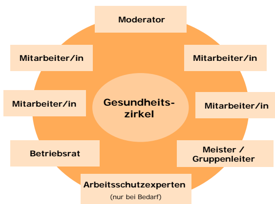
Abb. 2: Zusammensetzung eines Gesundheitszirkels

Es hat sich als sehr hilfreich erwiesen, die Zirkelsitzungen von einem neutralen Moderator leiten zu lassen. Gesundheitszirkel können im Betrieb flächendeckend oder auch in bestimmten Problembereichen projektbezogen eingesetzt werden.