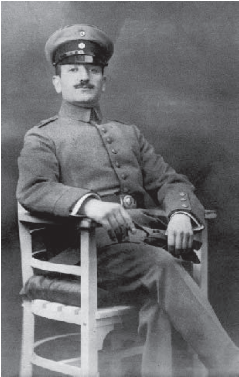
Hugo van Son, 1916