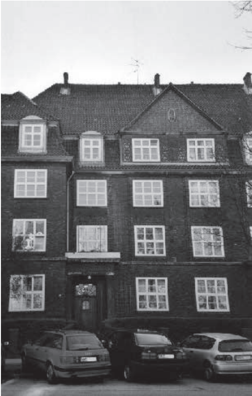
Seit Ende Februar 1942 wohnte Regina van Son im 2. Stock des Hauses Bogenstraße 25 in Hamburg (Foto von 2003)