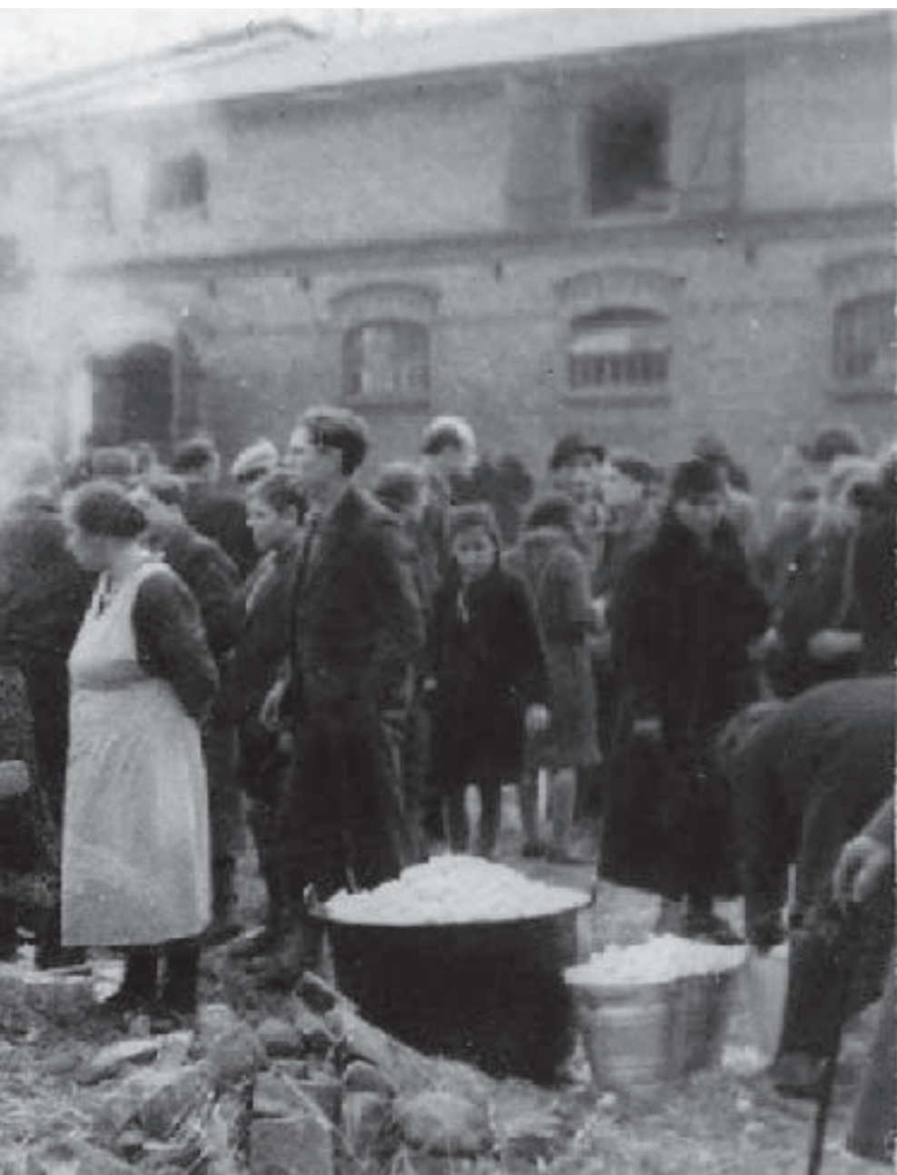
Jüdische Deportierte in Zbaszyn