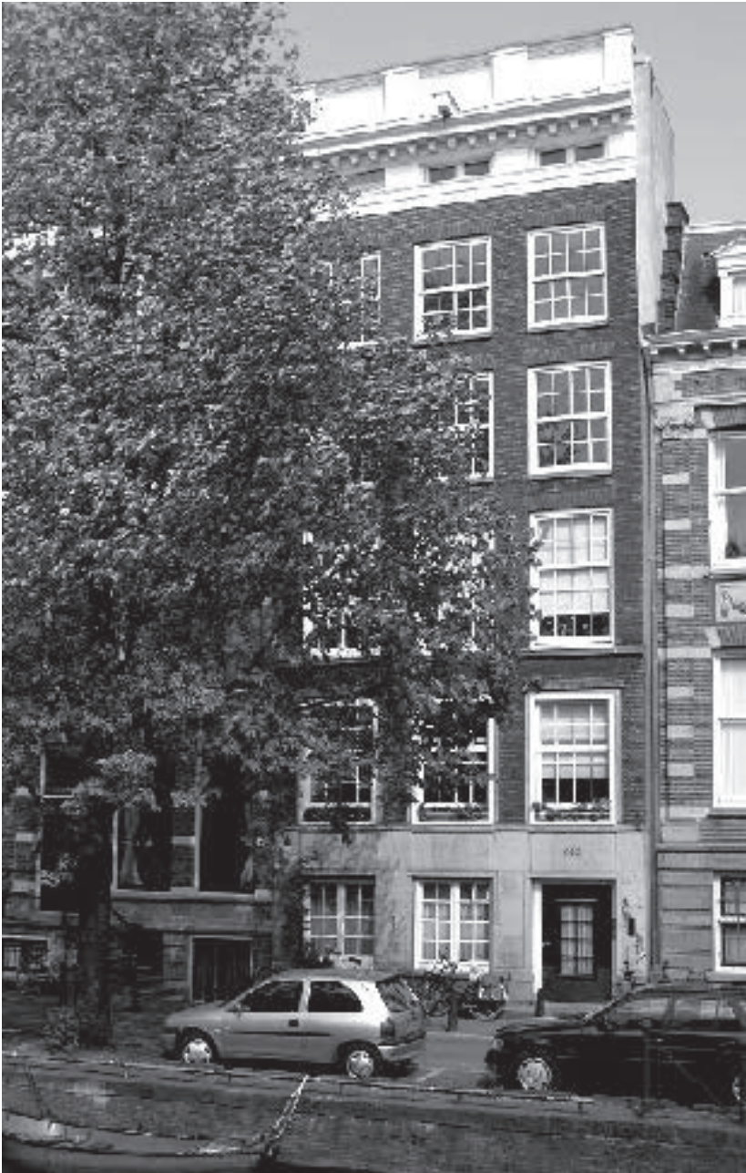
Das Haus Oudezijds Voorburgwal 223 in Amsterdam mit der damaligen Wohnung des Neffen Herbert Oettinger (Foto von 2005)