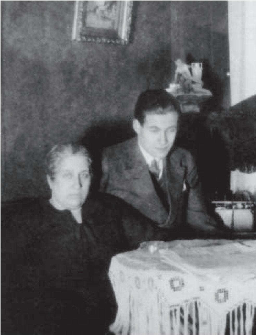
Familie van Son in der Hansastr. 38, Januar 1928