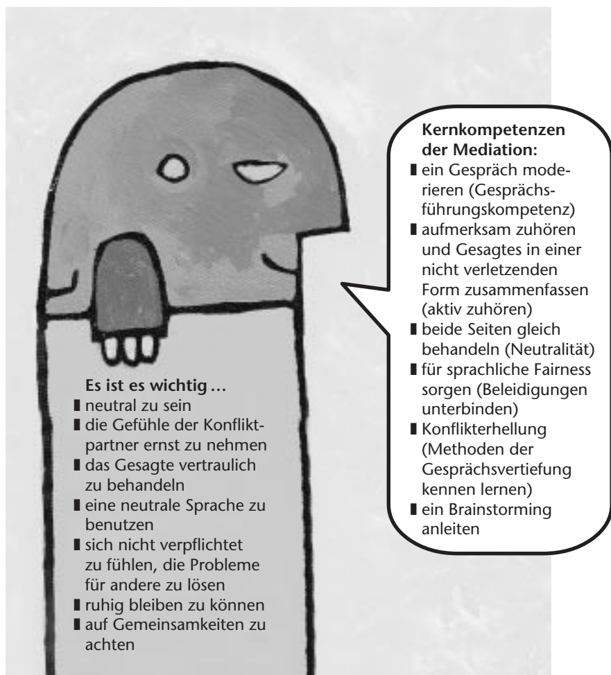
Abbildung 2: Kompetenzen der Streitschlichterinnen und Streitschlichter

„Früher wäre ich ausgerastet, heute bleibe ich ruhig.“ (Streitschlichter einer Gesamtschule)