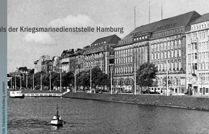
Gericht des Admirals der Kriegsmarinedienststelle Hamburg Ballindamm 25

Foto: Staatsarchiv Hamburg, 1950-er Jahre