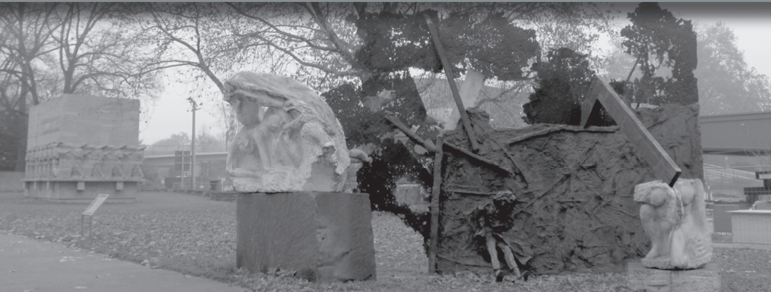
76er Kriegerdenkmal (Hintergrund) von Richard Kuöhl (1936) und Gegendenkmal von Alfred Hrdlicka (1985/86), November 2013