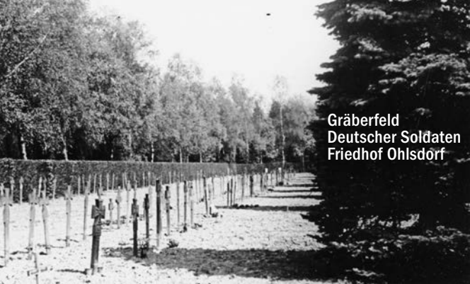
Gräberfeld Deutscher Soldaten Friedhof Ohlsdorf